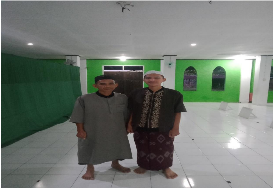
Foto bersama pimpinan pondok pesantren Nurul Hijrah