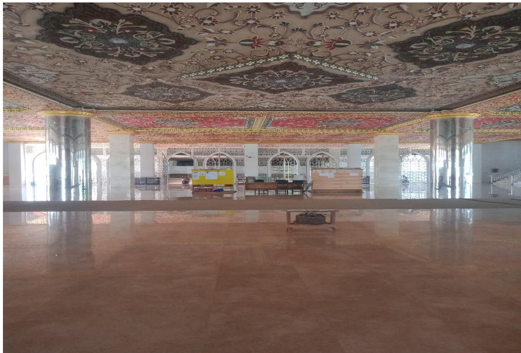
Lantai 1 masjid Agung Sukamara