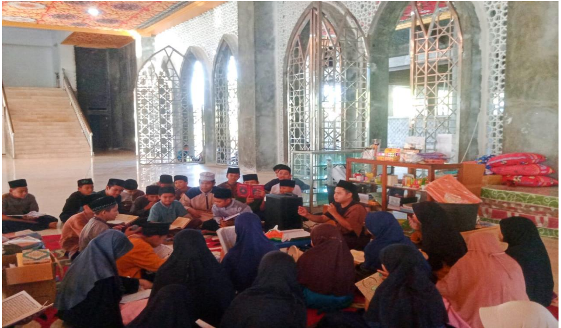
Foto kegiatan bimbingan keagamaan