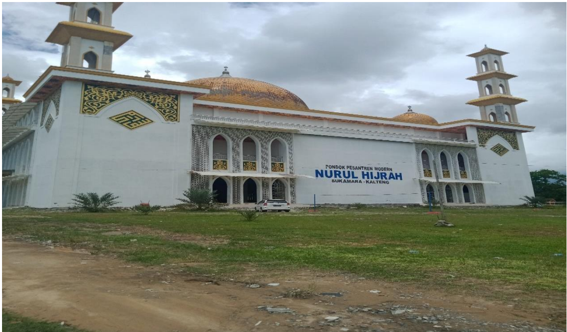
Foto pondok pesantren Nurul Hijrah Kabupaten Sukamara Kalimantan Tengah