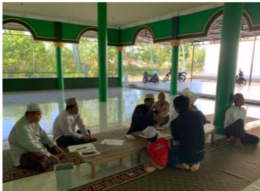
Gambar 4.1 Panitia Zakat Menghimpun Zakat Fitrah

Sebelum melaksanakan penghimpunan zakat fitrah, panitia zakat memberitahukan pengumuman bahwa penghimpunan zakat fitrah bisa diantarkan ke langgar setelah salat ashar, hal itu diberitahukan pada 27 Ramadhan atau 3 hari sebelum hari raya idul fitri .