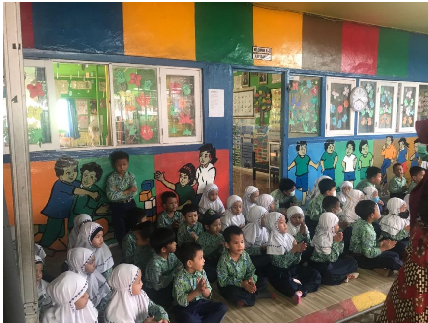
Gambar 4.2 pelaksanaan istighosah di RA Samudera raya

Berdasarkan hasil observasi yang dilakukan pada tanggal 7 Maret 2023 terlihat dilaksanakannya istighosah di luar kelas dan ada satu orang guru yang menjadi pembimbing pelaksanaan istighosah pada hari itu. Istighosah dimulai pukul 08.00 - selesai dengan serangkaian materi istighosah dibaca secara bersama-sama dan semua peserta didik diharapkan ikut serta dalam pelaksanaannya. Pada saat pelaksanaan istighosah guru memberikan microfon kepada salah satu murid atau memanggil peserta didik untuk maju kedepan sesuai dengan kelas berkelompok untuk memimpin bacaan yang dibaca secara bergantian.