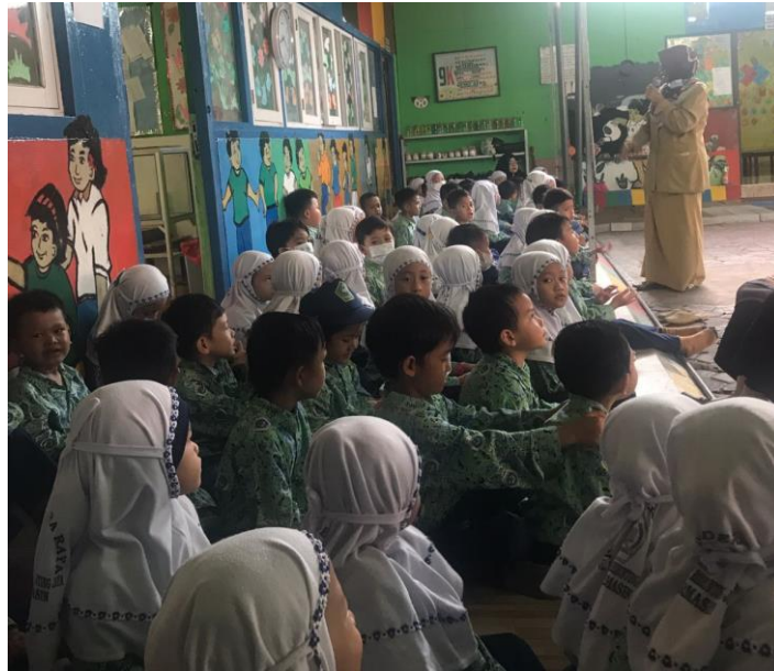
Gambar 4.5 pelaksanaan istighosah di teras kelas