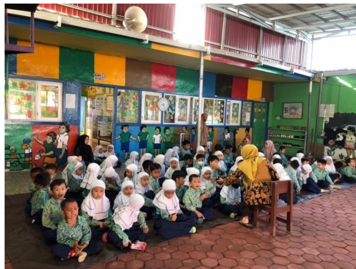
Gambar 4.6 Pelaksanaan istighosah di halaman sekolah