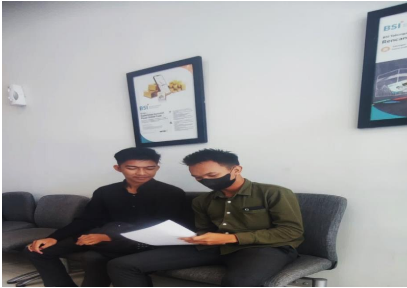
Dokumentasi pembagian kuesioner kepada nasabah pengguna Mobile Banking di Bank Syariah Banjarmasin