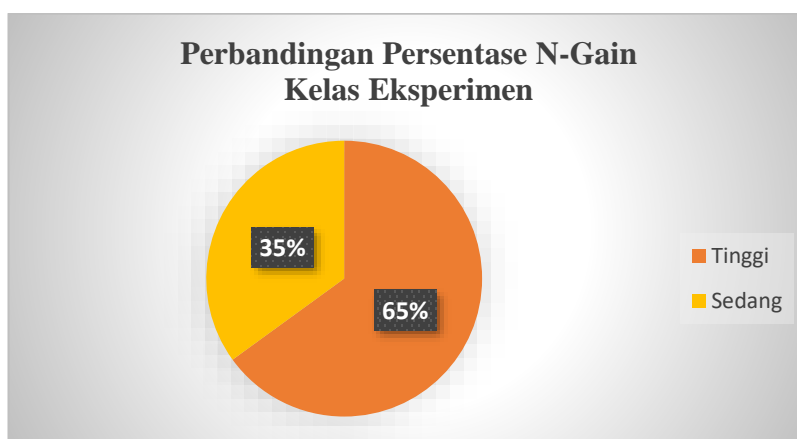
Gambar 4.1 Diagram Interpretasi N-Gain Kelas Eksperimen

Berdasarkan tabel 4.1 dapat dilihat peningkatan kemampuan berhitung siswa serta interpretasi peningkatannya pada setiap individu. Selanjutnya, Persentase interpretasi N-Gain disajikan pada gambar berikut ini.