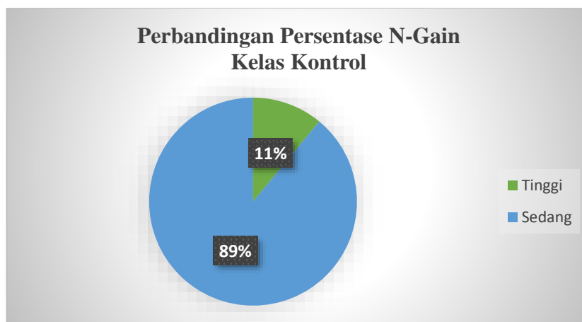
Gambar 4.2 Diagram Interpretasi N-Gain Kelas Kontrol

Berdasarkan tabel 4.3 dapat dilihat peningkatan kemampuan berhitung siswa beserta interpretasi peningkatannya. Kemudian persentase interpretasi N-Gain dari data tersebut disajikan pada gambar berikut.