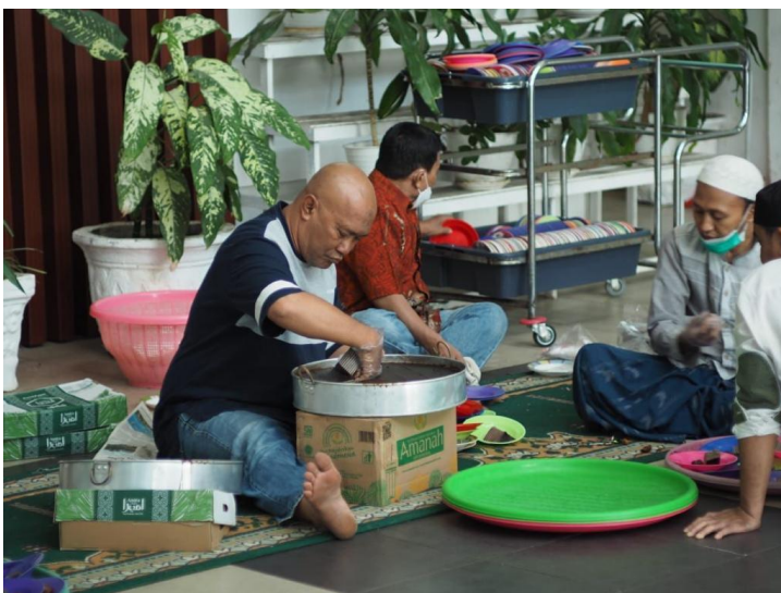
Kegiatan buka puasa bersama