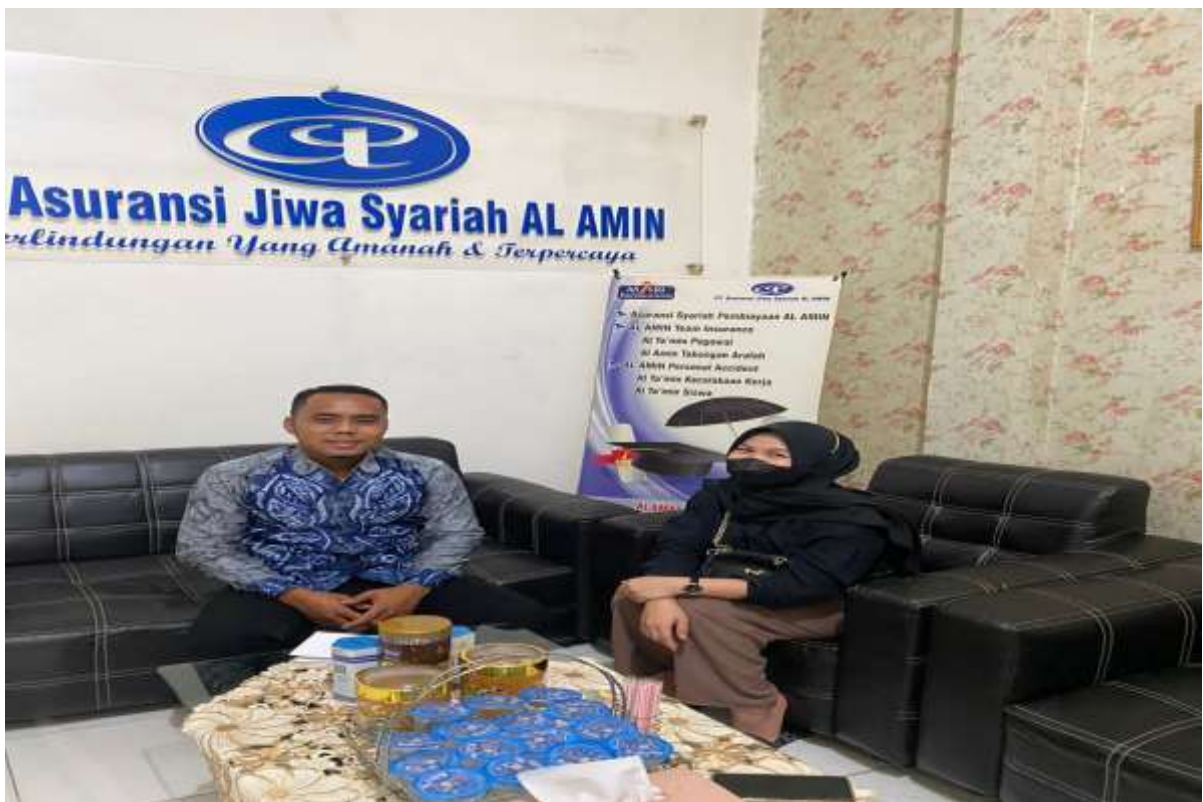
Wawancara dengan kepala perusahaan PT. Asuransi Jiwa Syariah Al-Amin Banjarmasin