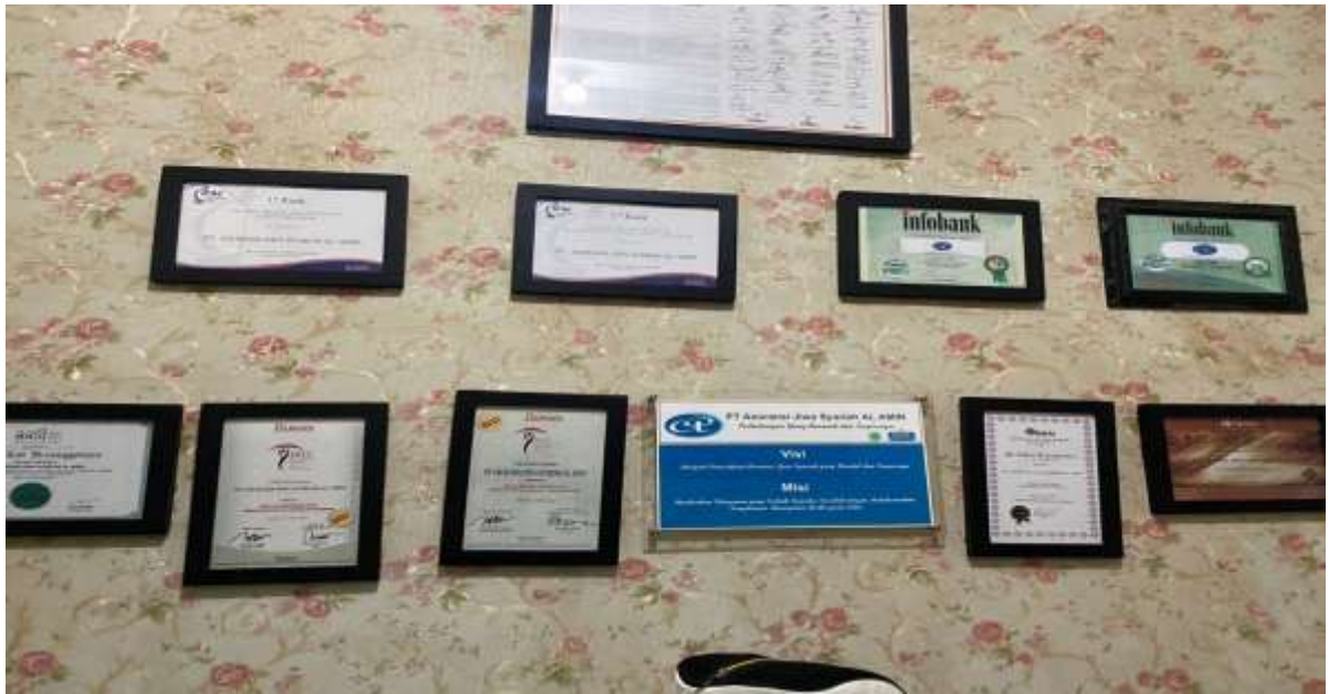
Penghargaan perusahaan PT. Asuransi Jiwa Syariah Al-Amin Banjarmasin