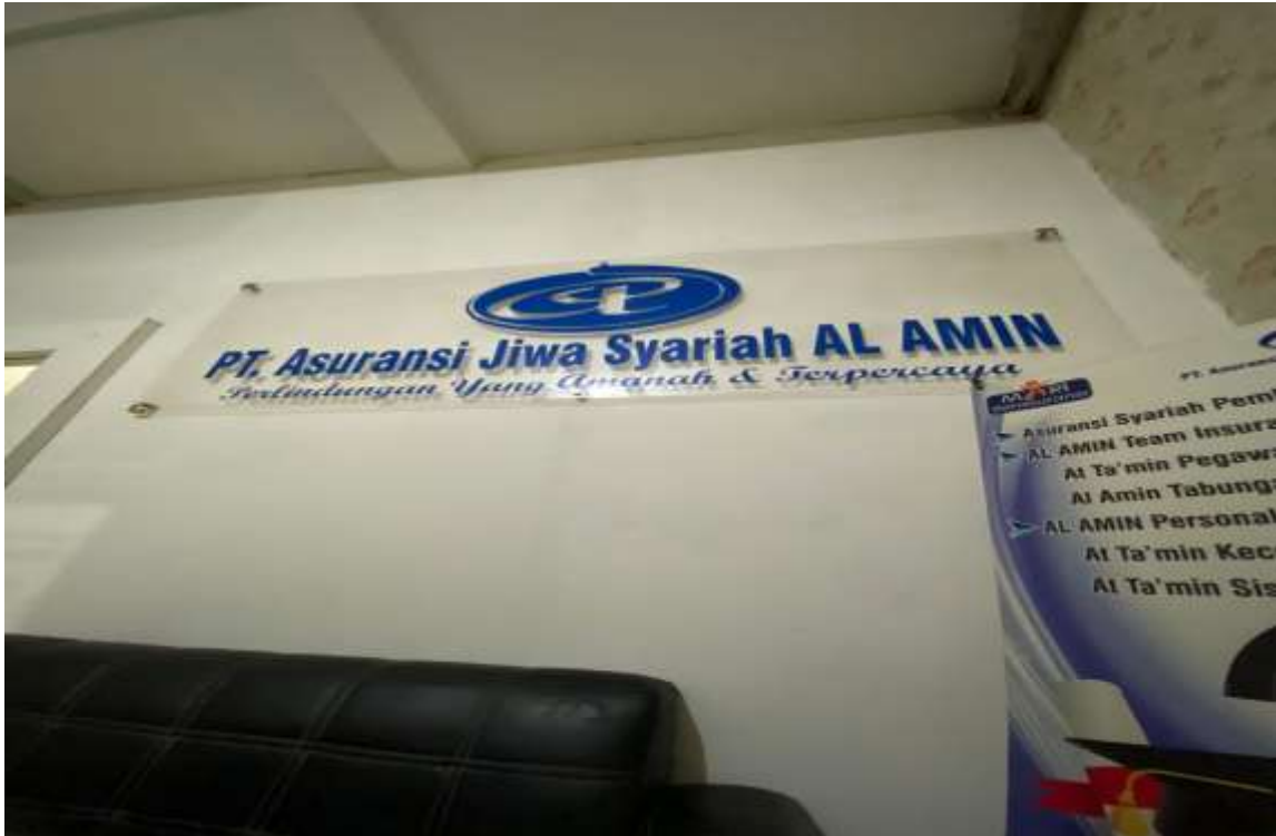
Tampak dalam Perusahaan PT. Asuransi Jiwa Syariah Al-Amin Banjarmasin