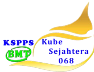
Gambar I. Logo BMT KUBE Sejahtera Unit 068

Sumber 4.1 buku SOM&SOP Panduan Operasional Manajemen dann Prosedur BMT