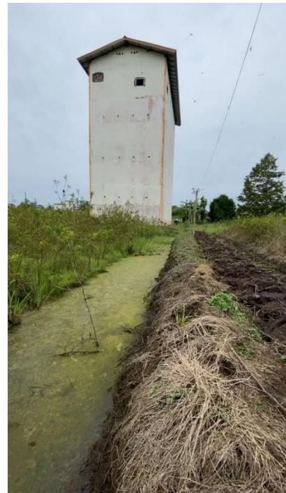
Rumah Burung Walet di Area Persawahan