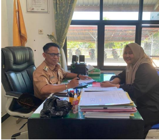
Foto bersama Camat Kec.Katingan Kuala