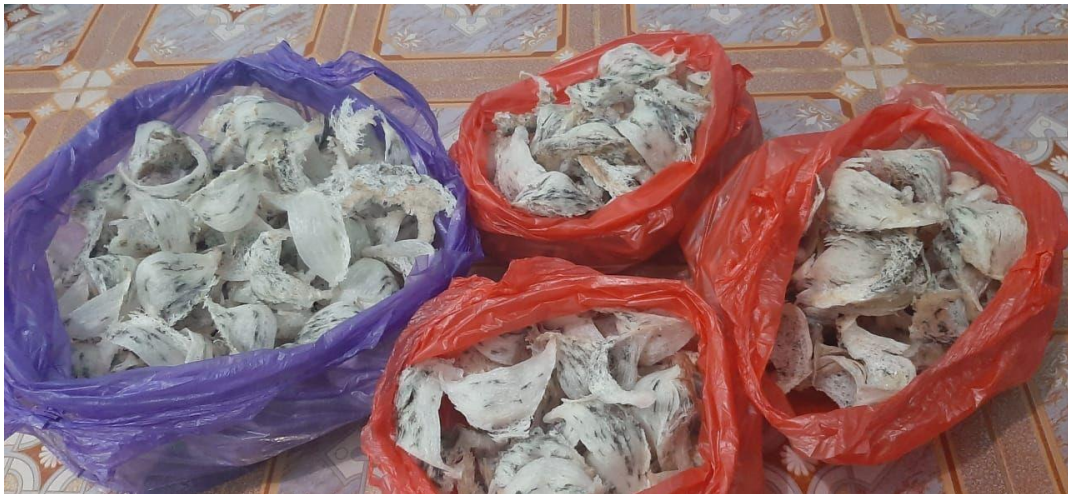
Sarang Burung Walet