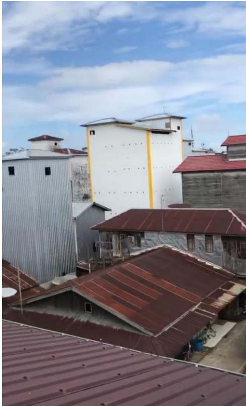
Rumah Burung Walet di Area Perkampungan