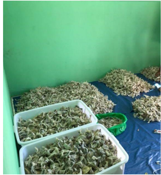
Proses Sortir Sarang Burung Walet