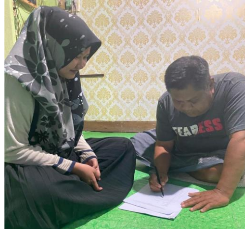
Foto bersama Responden