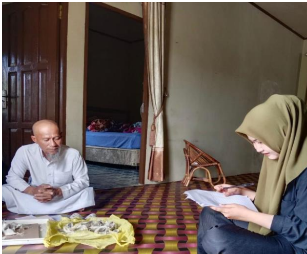
Foto bersama Pengepul