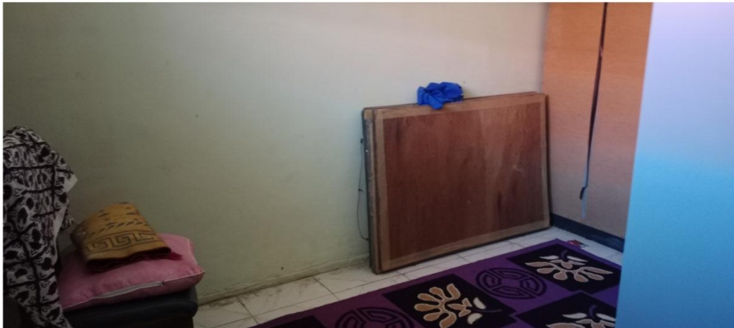
Ruang BK di SMKN 1 Gambut Kabupaten Banjar