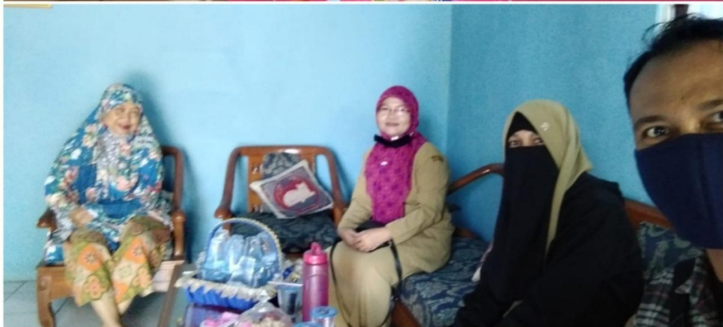
Pelaksanaan Home Visit oleh guru BK