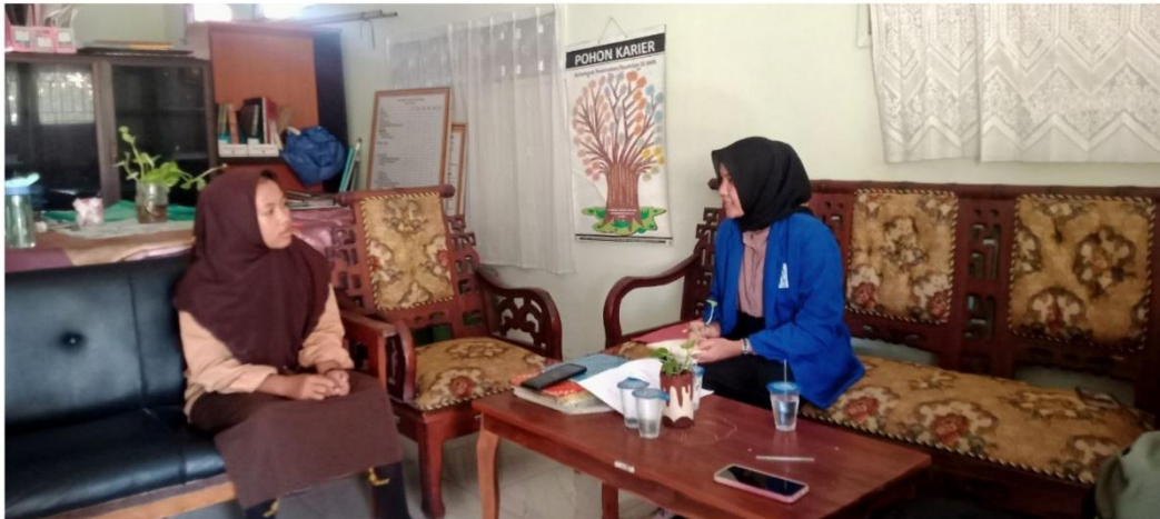
Wawancara dengan siswa AS, MRP dan HA