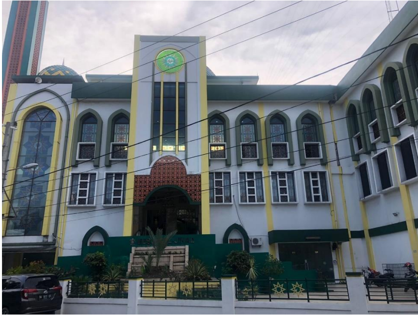
Gambar Masjid Al Jihad