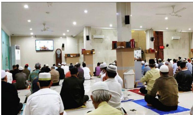
Gambar 4.9 Kajian Subuh Ahad Masjid Al Jihad