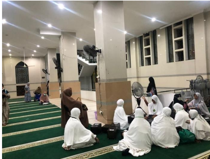
Gambar 4.5 Perhitungan Kotak Celengan Masjid Al Jihad