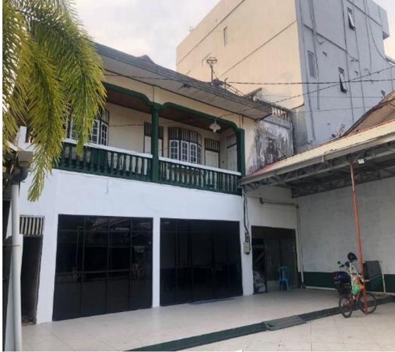
Gambar 4.6 Rumah Samping Masjid Al Jihad