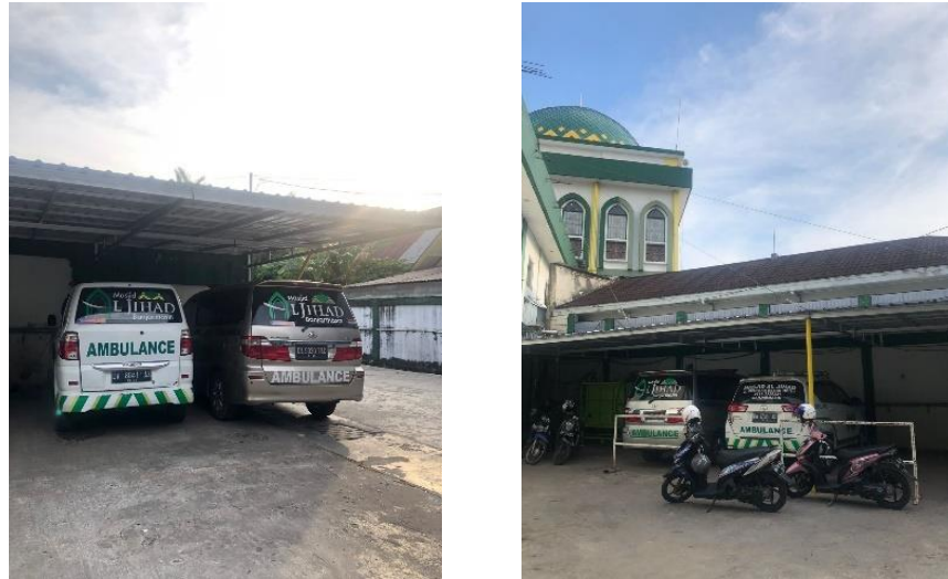
Gambar 4.2 Mobil Pengantaran Jenazah Masjid Al Jihad