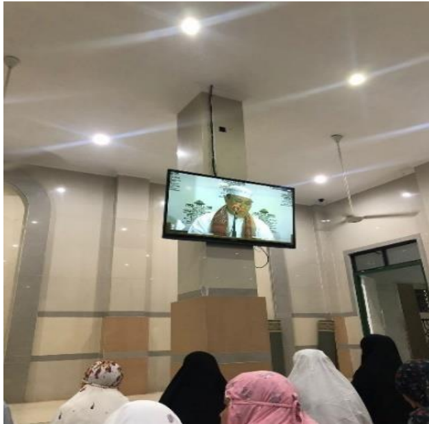
Gambar 4.10 Kegiatan Ceramah Rutinan