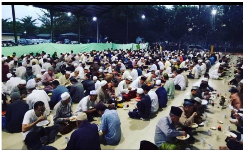
Gambar 4.8 Makan Bubur Subuh Ahad Masjid Al Jihad