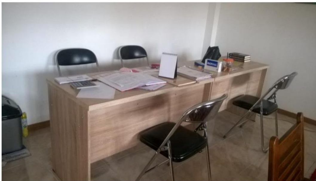
Gambar. 4.4. Kantor Kesekretariatan Panti Asuhan Muhammadiyah Nuruddin