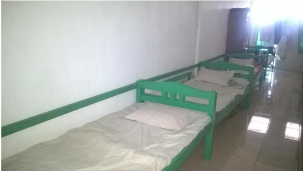
Gambar. 4.3. Tempat Tidur Panti Asuhan Muhammadiyah Nuruddin