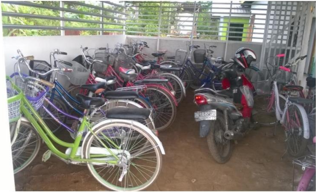
Gambar. 5.1. Tempat Parkir Panti Asuhan Muhammadiyah Nuruddin