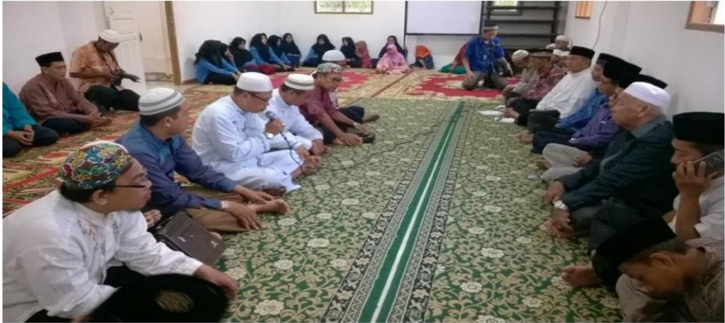
Gambar 3.3 Kegiatan Keagamaan, Pembacaan Maulid Rasul Setiap Malam Senin Bersama Tokoh Agama Dan Masyarakat.