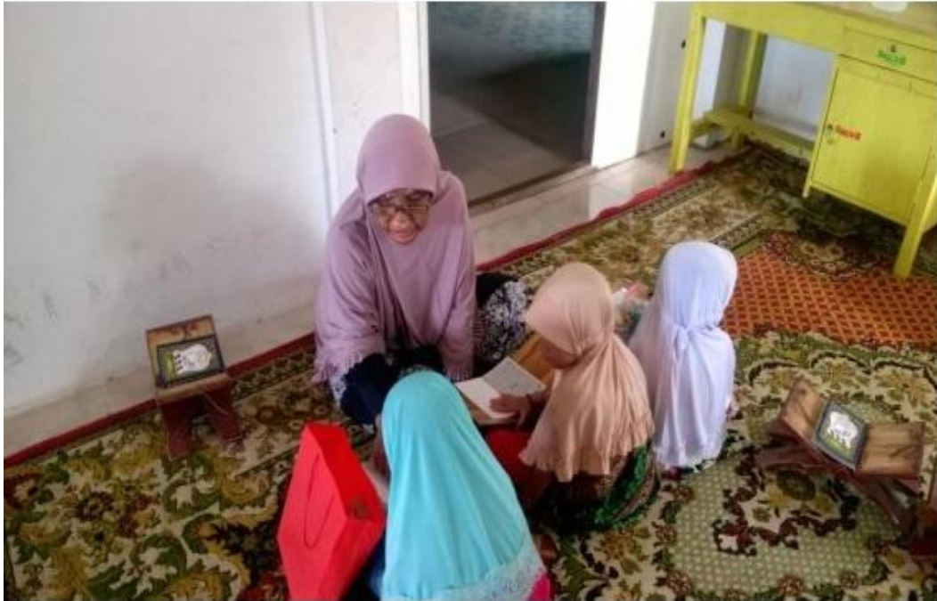
Gambar. 4.1. Pembelajaran Pembiasaan Mengaji