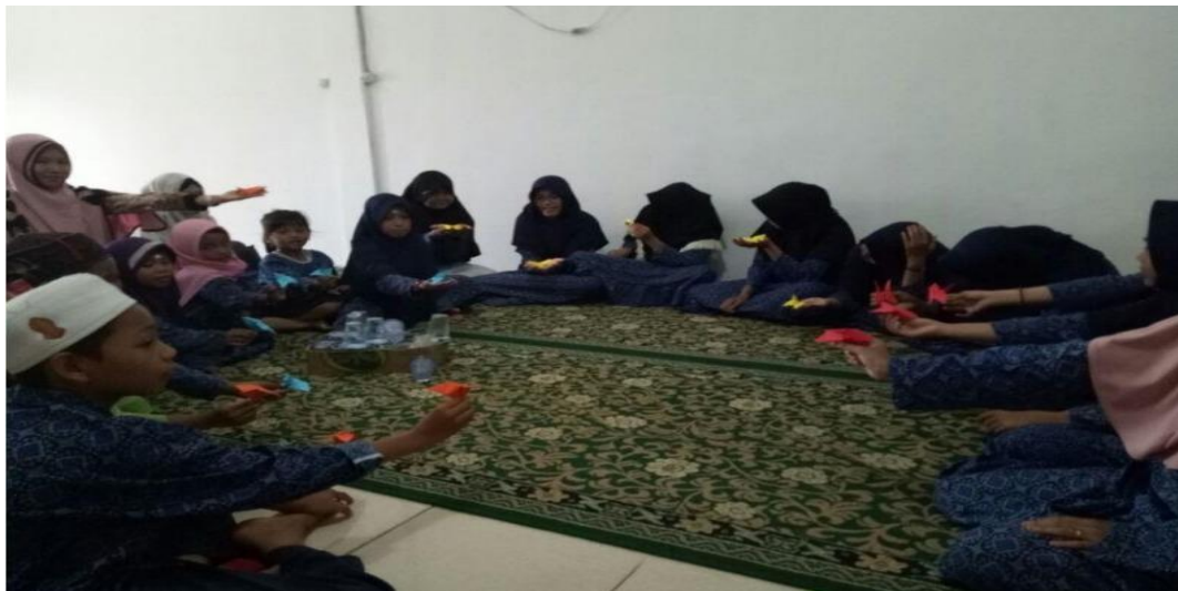
Gambar. 3.4. Kegiatan Pembelajaran Akhlak Belajar Sambil Bermain