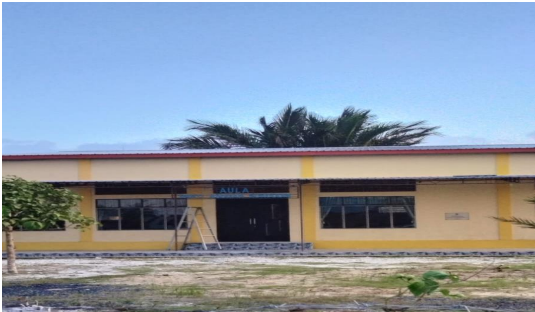
Gambar. 5.2. Gedung Aula Serbaguna Panti Asuhan Muhammadiyah Nuruddin