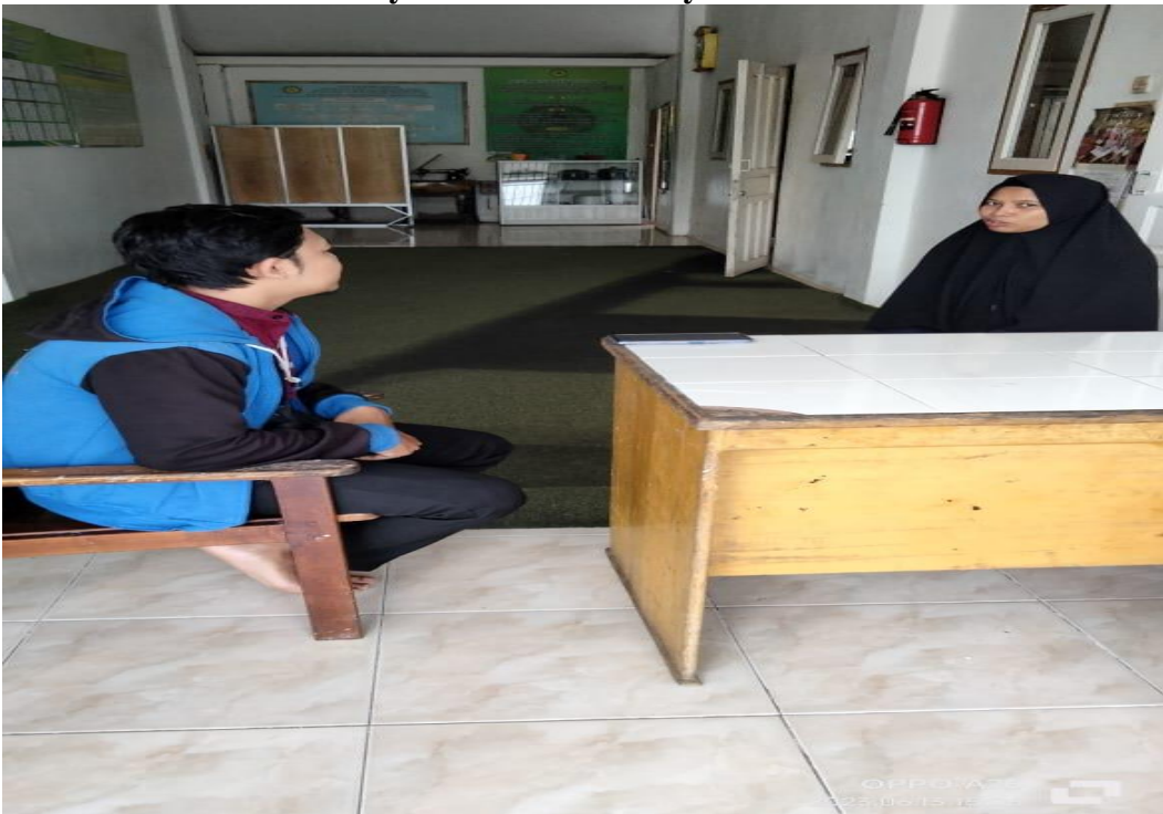
Gambar 3.2 Wawancara Kedua Bersama Ibu Pengasuh Panti Asuhan Muhammadiyah Nuruddin Kelayan Timur.