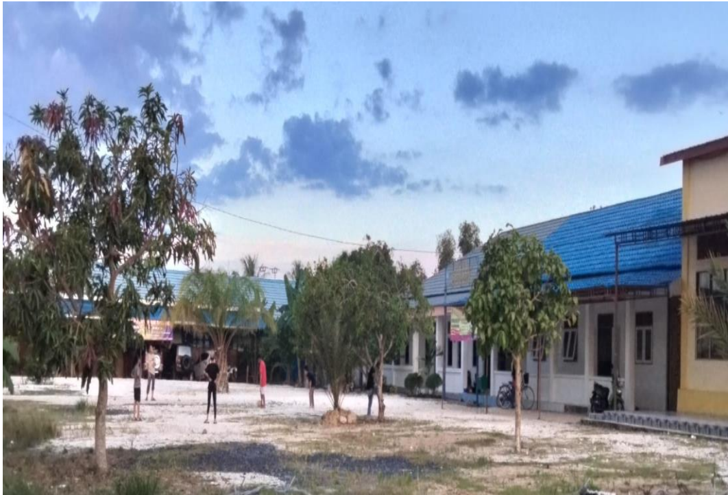
Gambar. 5.3. Halaman Depan Panti Asuhan Muhammadiyah Nuruddin