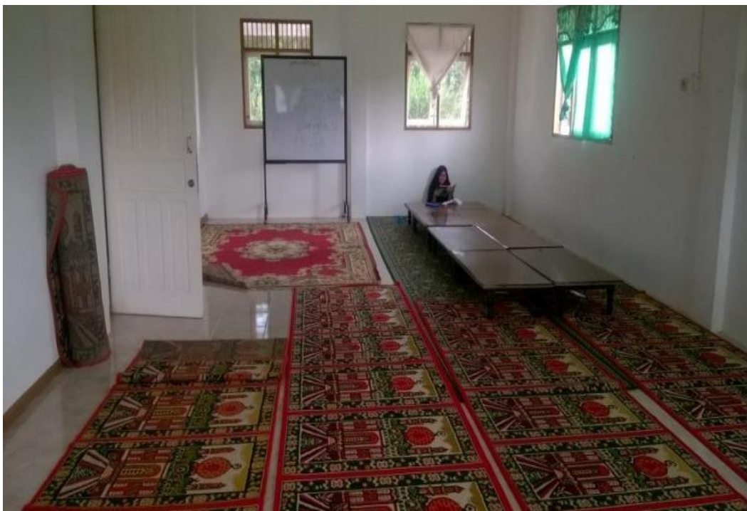
Gambar. 4.2. Tempat Mushola Panti Asuhan Muhammadiyah Nuruddin