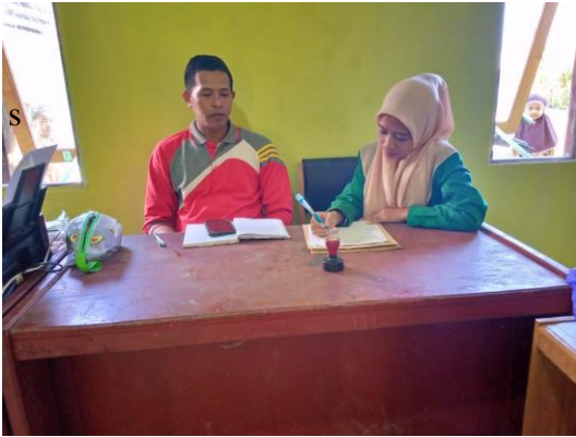
Foto Wawancara dengan Guru-guru dan Observasi lapangan di MI Tasrihul Islam Gambut.