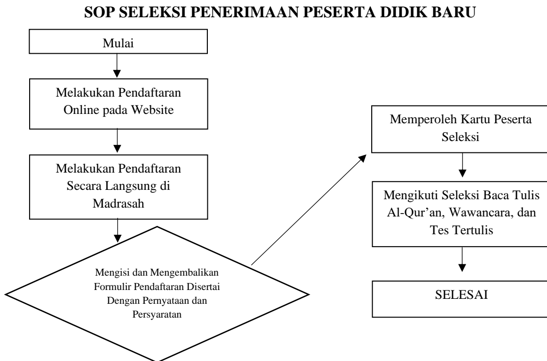
Gambar 4.1 Alur Kerja SOP Seleksi Penerimaan Peserta Didik Baru

Kegiatan pelaksanaan manajemen penerimaan peserta didik baru di MAN 2 Banjarmasin melakukan pendekatan kepada calon peserta didik baru yakin dengan menyebarkan spanduk di beberapa tempat tertentu khususnya Madrasah tsanawiyah. Kata bapa Arbain MAN 2 adalah madrasah yang menyandang gelar yang namanya madrasah Aliyah negeri model kemudian semenjak tahun 2019 berubah menjadi madrasah plus keterampilan, selain itu didalamnya juga madrasah Aliyah yang berasrsama model ma'had oleh karena itu keunggulan ini harus di sampaikan kepada masyarakat. Pada program keterampilan itu wajib di ikuti