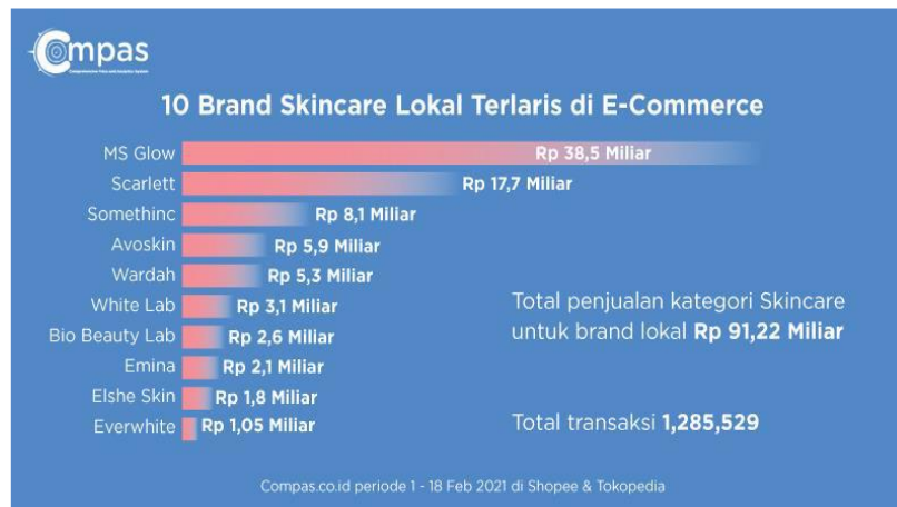
Gambar 1.2 Penjualan Produk Skincare Brand Lokal Terlaris di shopee dan Tokopedia