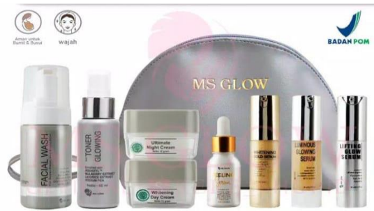
Gambar 1.1 Produk MS Glow