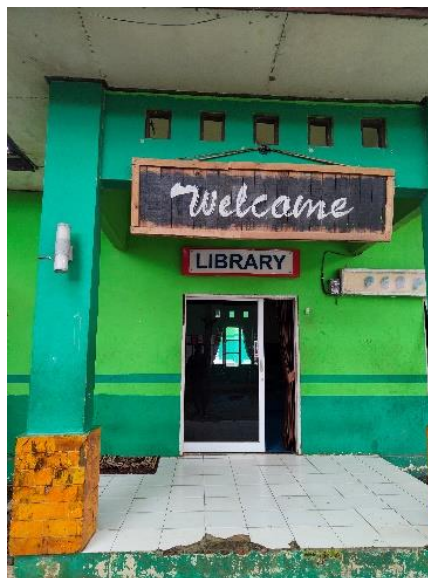
Gambar 4.1 Gedung Perpustakaan Pondok Pesantren Darul Hijrah Putra

Perpustakaan merupakan salah satu tempat kegiatan belajar mengajar berlangsung didalamnya menyediakan bahan pustaka yang dapat dijadikan bahan referensi baik bagi siswa/santri maupun bagi guru. Di dalam perpustakaan juga terdapat fasilitas lainnya berupa perabot atau perlengkapan, dan media pendidikan lainnya.