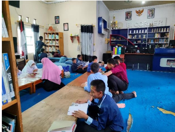
Gambar 4.3 Kegiatan Pembelajaran di Perpustakaan

Berdasarkan hasil wawancara dan gambar 4.3 diatas dapat disimpulkan bahwa adanya instruksi dari bagian pengajaran dan pimpinan pondok kepada pengajar dan santri untuk memanfaatkan perpustakaan sebagai sumber belajar. Hal ini termasuk pemanfaatan koleksi yang mana digunakan santri sebagai bahan referensi tambahan untuk mengerjakan tugas dan tugas akhir untuk santri akhir. Termasuk juga didalamnya pemanfaatan ruang perpustakaan sebagai tempat diskusi, kegiatan belajar mengajar, dan ruang rapat Ustaz dan Ustazah di perpustakaan. Disamping pemanfaatan koleksi dan ruang, adapula pemanfaatan perpustakaan sebagai hiburan dan rekreasi. Santri memanfaatkan perpustakaan sebagai hiburan ketika mereka lagi jenuh dan sumpek.