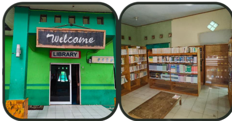
Gambar 4.5 Gedung utama dan tempat penyimpanan koleksi terpisah

Terlihat pada gambar 4.5 bahwasanya gedung utama dan tempat penyimpanan koleksi perpustakaan terpisah. Adanya pembagian ruang perpustakaan yang terbagi menjadi dua, berimbas pula dengan koleksi perpustakaan. Koleksi perpustakaan di gedung utama ini kurang dan seadanya, dikarenakan koleksinya terpisah dengan gedung utama perpustakaan, sehingga hal ini menjadi faktor penghambat dalam pemanfaatan fasilitas perpustakaan sebagai sumber belajar pada pondok pesantren darul hijrah putra. Hal ini berdasarkan wawancara penulis dengan Guru/Ustazah, beliau mengungkapkan bahwa: