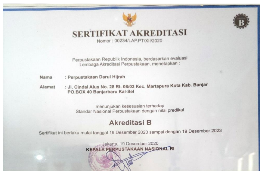
Gambar 4.2 Sertifikat Akreditasi

“Untuk akreditasi perpustakaan pondok pesantren darul hijrah memiliki akreditasi B yang didapat pada 19 desember 2020.” 43