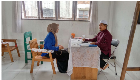
Wawancara bersama Guru Pengajar Al-qur'an Utama Tingkat Lanjutan