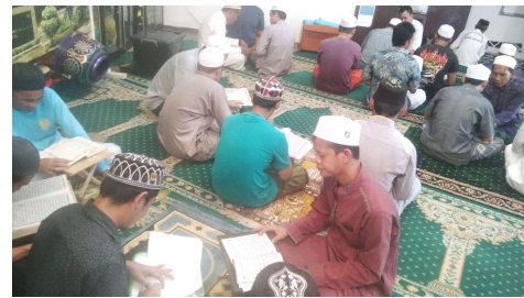
Observasi Kegiatan Program Pembelajaran Al-qur'an Tingkat Dasar