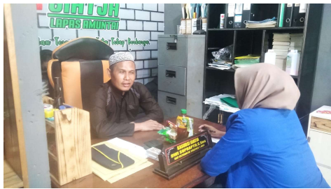
Wawancara bersama Tim Pengajar Al-qur'an 1