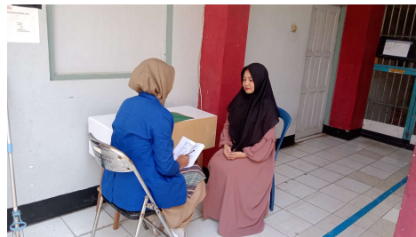
Wawancara bersama Narapidana 4