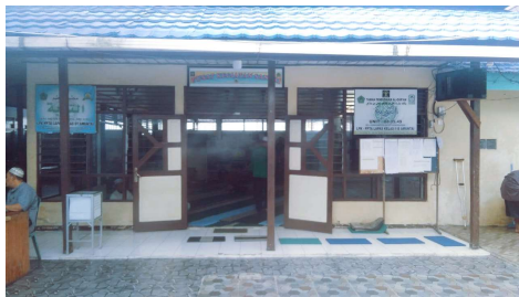
Mesjid At-Taubah Lapas IIB Amuntai tampak dari depan