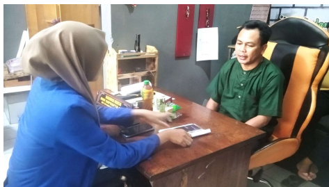
Wawancara bersama Tim Pengajar Al-qur'an 2