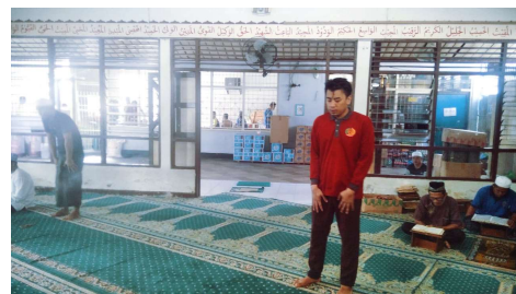
Mesjid At-Taubah Lapas IIB Amuntai tampak dari dalam