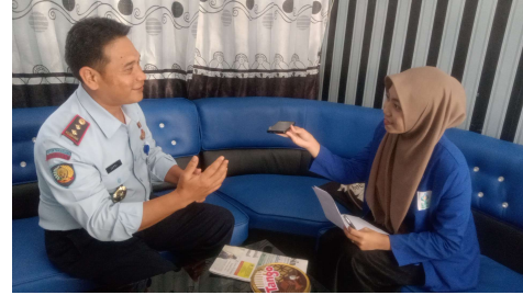
Wawancara bersama Kepala Lembaga Pemasyarakatan Kelas IIB Amuntai