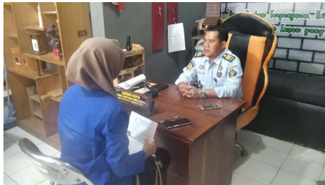
Wawancara bersama Pembina Kasi Binapiwatgiatja Lapas IIB Amuntai