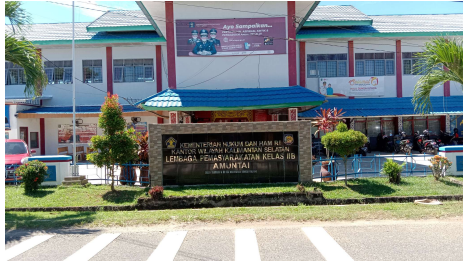
Lembaga Pemasarakatan Kelas IIB Amuntai tampak depan