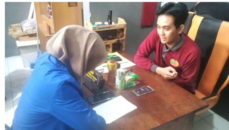
Wawancara bersama Narapidana 2