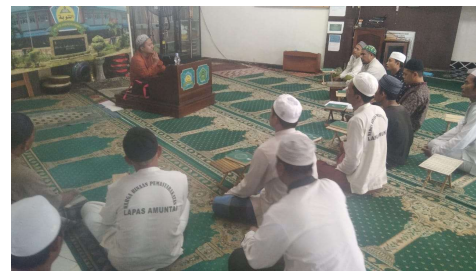
Observasi Kegiatan Program Pembelajaran Al-qur'an Tingkat Mahir