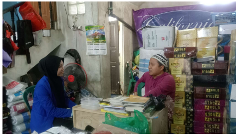
Wawancara bersama Guru Pengajar Al-qur'an Tingkat Mahir