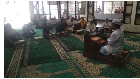
Observasi kegiatan Program Pembelajaran Al-qur'an Tingkat Lanjutan