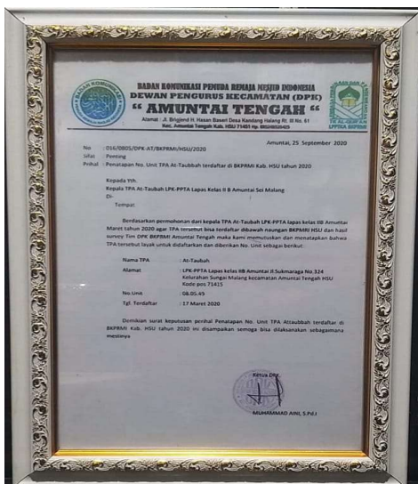
Piagam BKPRMI tentang No. Unit Pendaftaran TPA At-Taubah