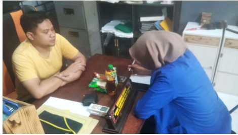
Wawancara bersama Narapidana 1