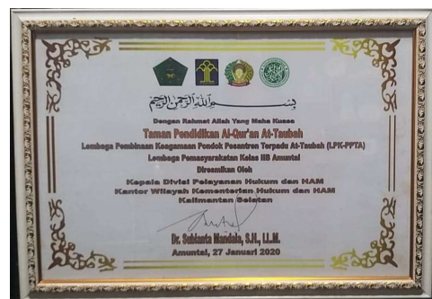
Piagam Peresmian TPA At-Taubah