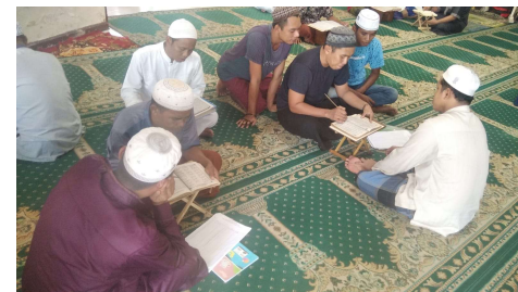
Observasi Kegiatan Program Pembelajaran Al-qur'an Tingkat Dasar