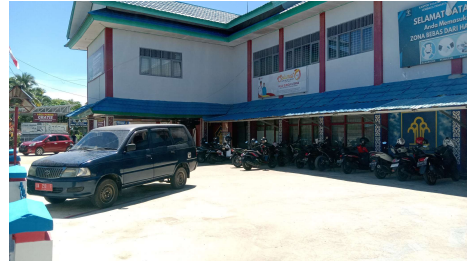
Lembaga Pemasarakatan Kelas IIB Amuntai tampak samping