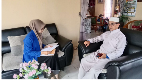
Wawancara bersama Pimpinan LPK-PPTA