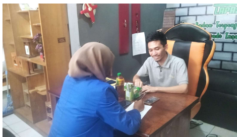
Wawancara bersama Narapidana 3