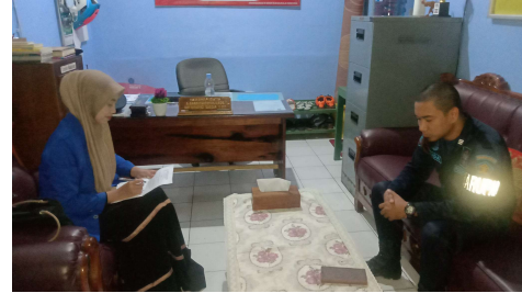
Wawancara bersama Ketua TPA/TPQ At-Taubah Lapas IIB Amuntai