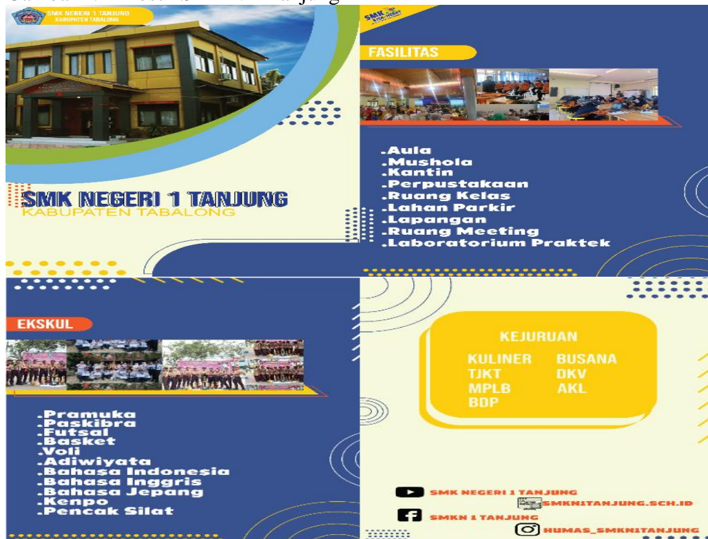
Gambar 4.1 Brosur SMKN 1 Tanjung

Didalam brosur tersebut dijelaskan apa saja yang ada di SMKN 1 Tanjung seperti fasilitas, ekskul, dan kejuruan dapun fasilitas yang ada di SMKN 1 Tanjung yaitu aula, mushola, kantin, perpustakaan, ruang kelas, lahan parkir , lapangan, ruang meeting, dan laboratorium praktek. Kemudian untuk ekskul yang ada disana yaitu pramuka, paskibra, futsal, basket, voli, adiwiyata, bahasa indonesia, bahasa inggris, bahasa jepang, kenpo, dan pencak silat. Adapun kejuruan yang ada di SMKN 1 Tanjung yaitu Teknik Jaringan dan Telekomunikasi, Desain Komunikasi Visual, Akuntansi Keuangan Lembaga, Manajemen Perkantoran dan Layanan Bisnis, Pemasaran, Jasa Boga, Multimedia, Busana Butik dan Otomatisasi Tata Kelola Perkantoran. SMKN 1