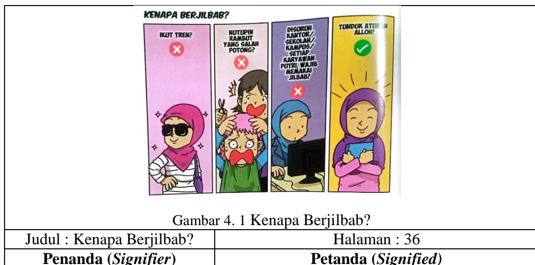
Tabel 4. 1 Beriman Kepada Allah