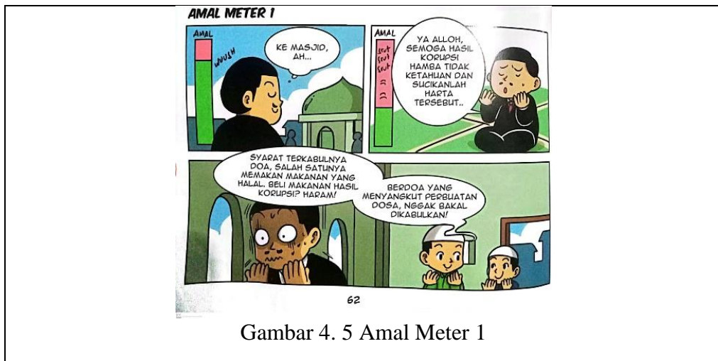
Gambar 4. 5 Amal Meter 1