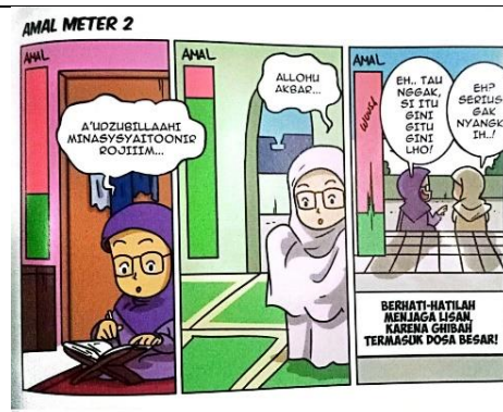
Gambar 4. 6 Amal Mater 2