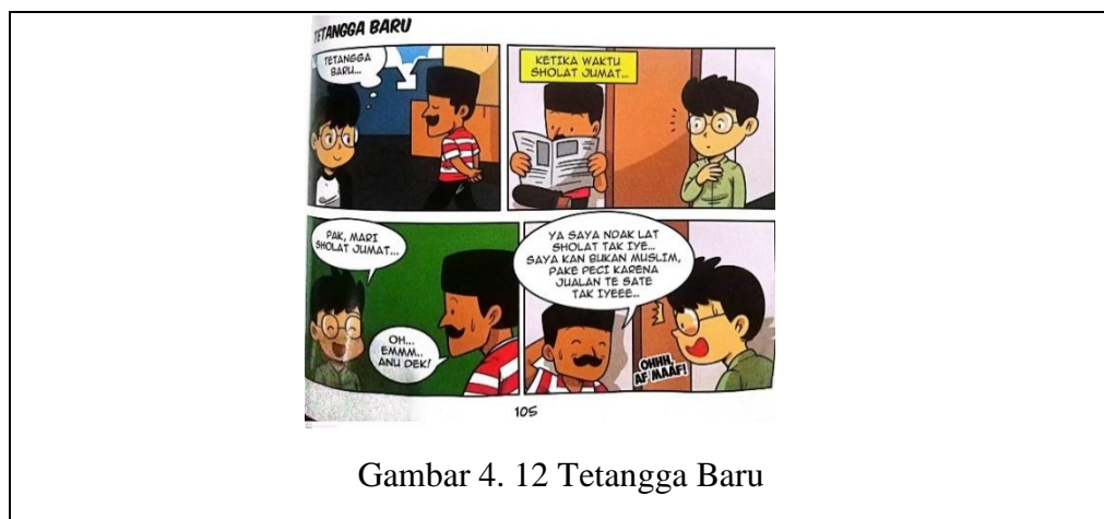
Gambar 4. 12 Tetangga Baru