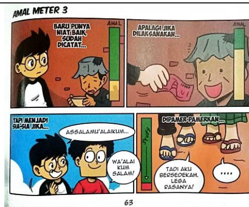
Gambar 4. 7 Amal Meter 3