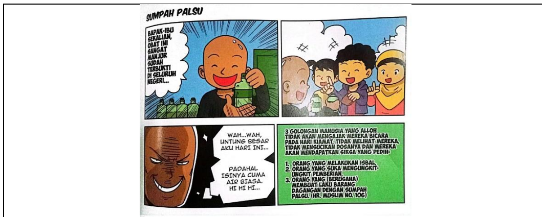
Gambar 4. 8 Sumpah Palsu