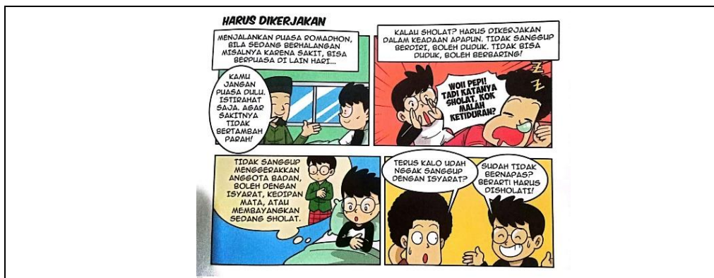
Gambar 4. 4 Harus Dikerjakan