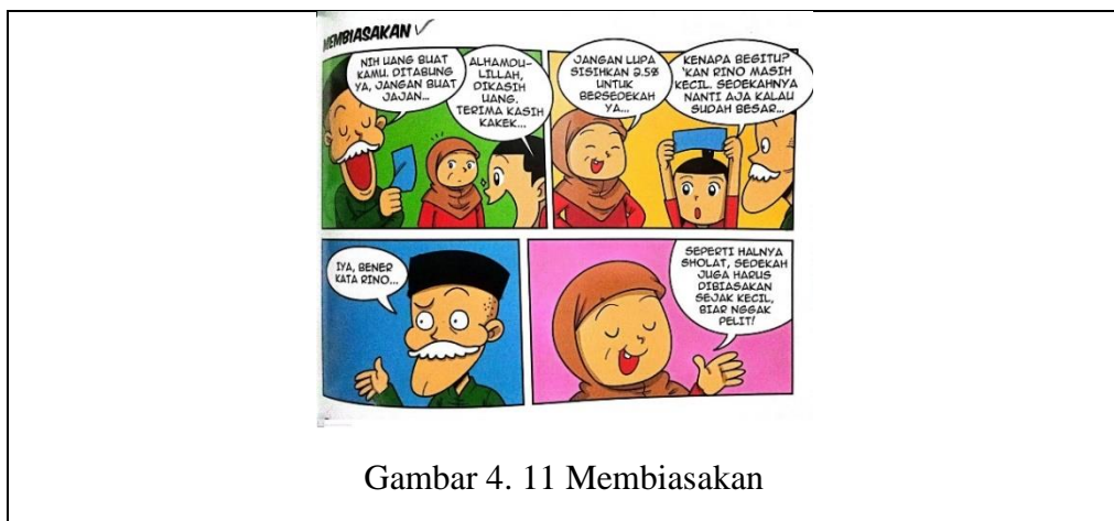
Gambar 4. 11 Membiasakan