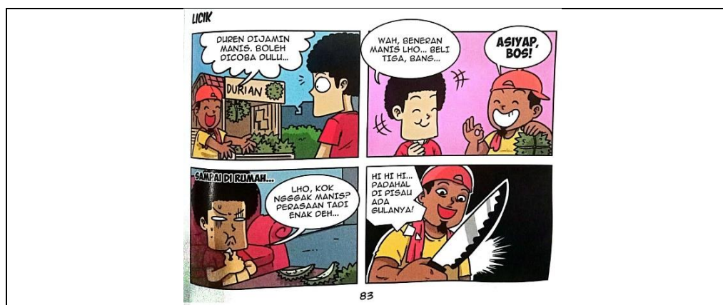
Gambar 4. 9 Licik