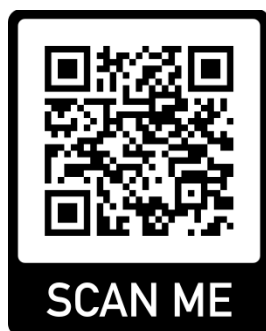
Gambar 3.1. Barcode google maps lokasi MAN 3 Banjar

Penelitian ini dilaksanakan di MAN 3 Banjar yang beralamat di Jln. A. Yani Km. 15.200, Gambut, Kabupaten Banjar, Kalimantan Selatan. Pada semester genap tahun ajaran 2022/2023. Berikut lokasi sekolah MAN 3 Banjar.