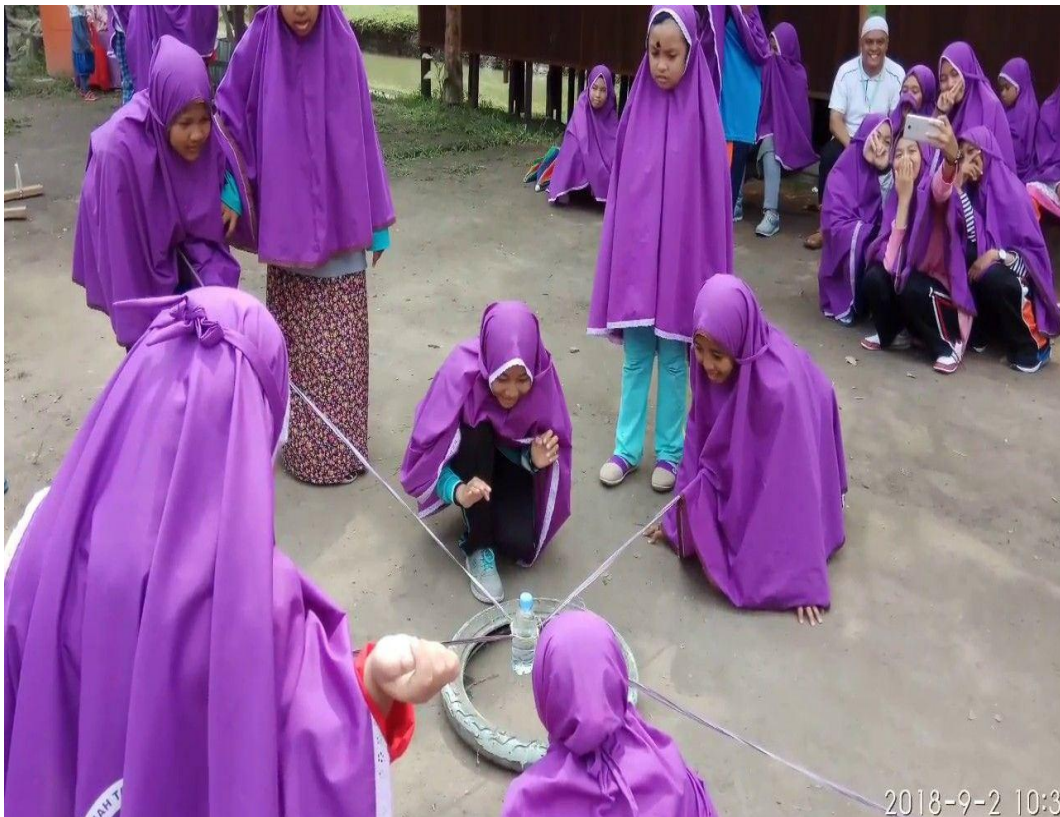
Permainan disela-sela ahlul qur'an