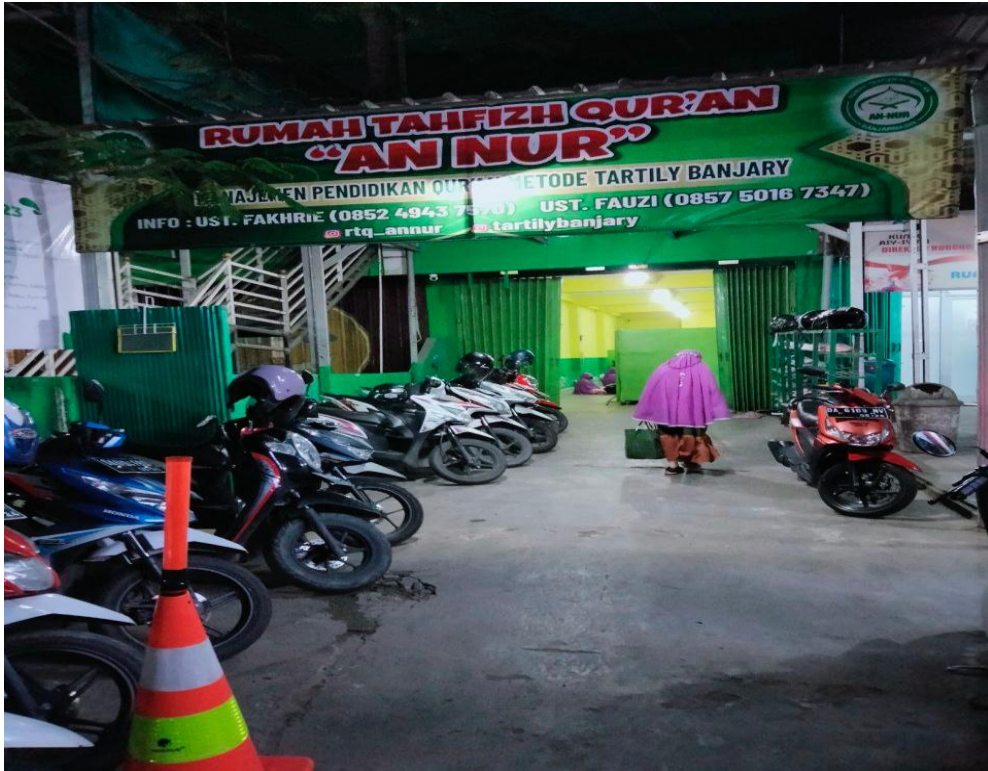
Tempat Parkir Rumah Tahfiz Annur Banjarmasin