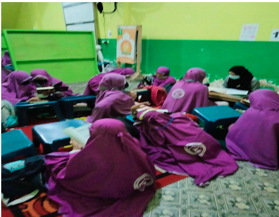
Kegiatan Belajar Santriwati Annur Banjarmasin