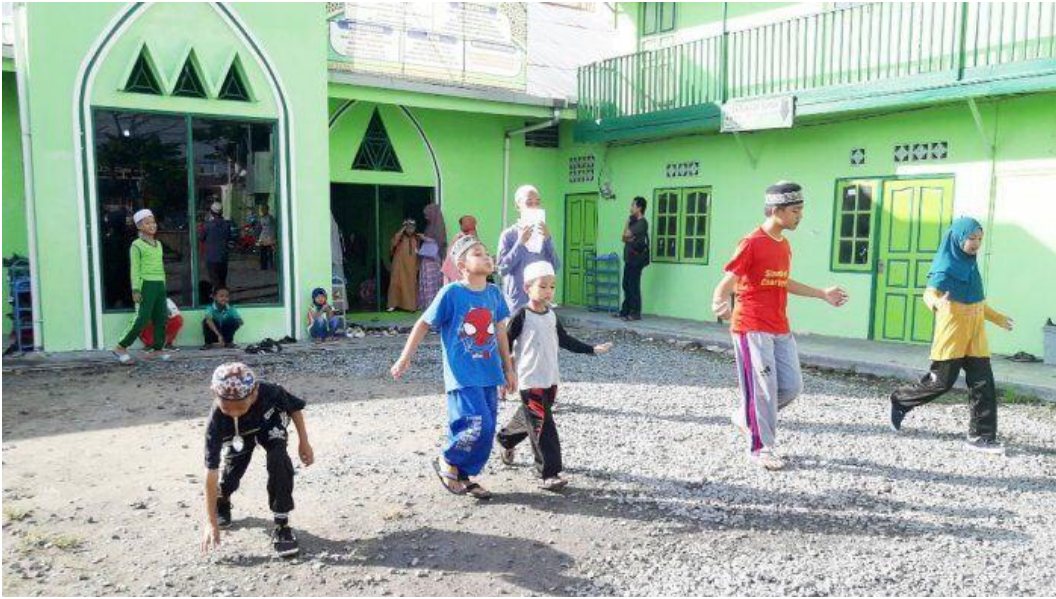
Permainan disela-sela ahlul qur'an