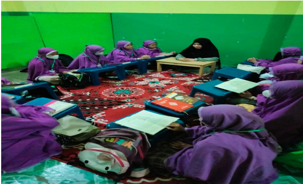
Kegiatan Belajar Kelompok Muftadi 3