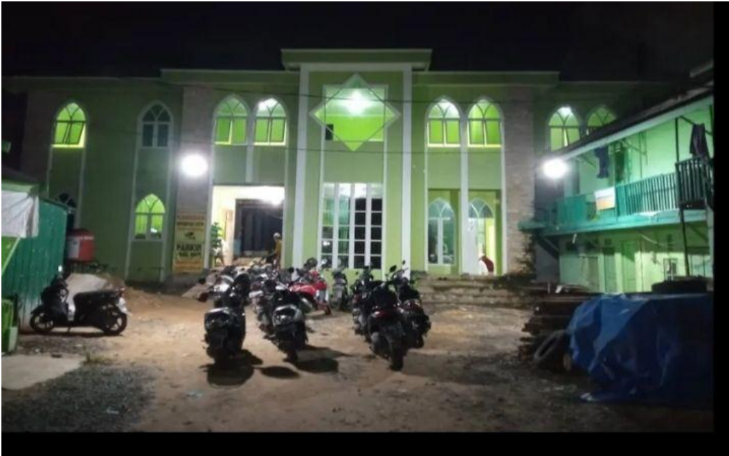
Gedung utama rumah tahfiz Annur Banjarmasin