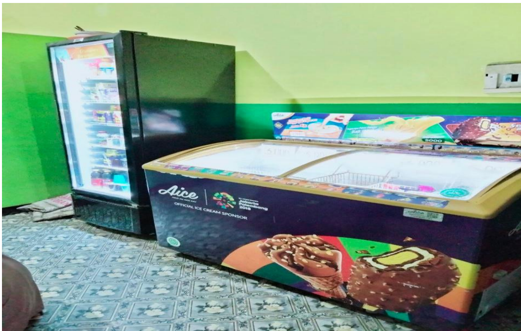
Koperasi Rmah Tahfiz Annur Banjarmasin