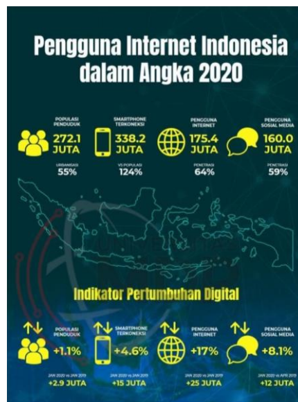
Gambar 1.1 Pengguna internet di Indonesia Tahun 2020

Gambar 1.1 menunjukkan bahwa pada tahun 2020, terdapat 175,4 juta pengguna internet reguler di Indonesia, atau 64% dari total populasi negara. Berdasarkan gambar di atas, terlihat jelas bahwa kemajuan teknologi berpengaruh signifikan terhadap jumlah pengguna internet di Indonesia yang meningkat pesat.