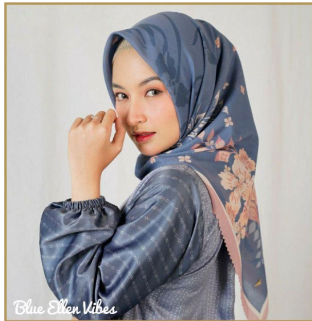
Gambar 4. 10 Motif Hijab Bunga