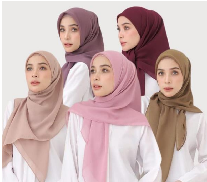
Gambar 4. 14 Hijab Segi Empat