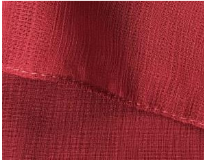
Gambar 4. 5 Bahan Corn