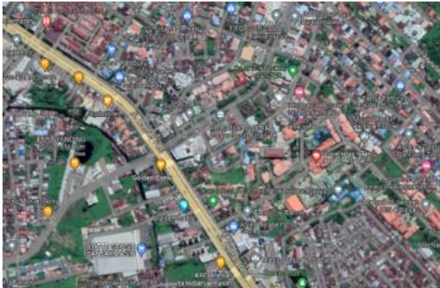
Gambar 4. 1 Denah Kampus 1 UIN Antasari Banjarmasin

UIN Antasari Banjarmasin sekarang memiliki dua kampus antara lain kampus pertama terletak di Jl. A. Yani No.Km. 4, RW. 5, Kebun Bunga, Kec. Banjarmasin Tim., Kota Banjarmasin, Kalimantan Selatan 70235 terletak sekitar 120 meter dari jalan raya Ahmad Yani. dekat komplek kampus UIN Antasari Banjarmasin.