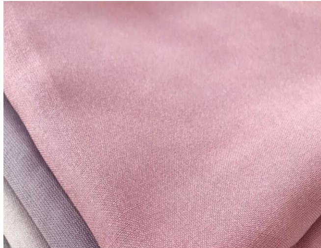
Gambar 4. 4 Bahan Voal

bisa menjadi pilihan. Bukan hanya warnanya yang beragam, ada pula jilbab yang dibuat dengan corak atau motif menarik. Sehingga, ketika mengenakan baju dengan warna polos, bisa memadukan dengan hijab voal motif untuk memberikan sentuhan tampilan yang lebih hidup.