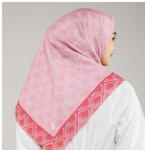
Gambar 4. 11 Motif Geometris