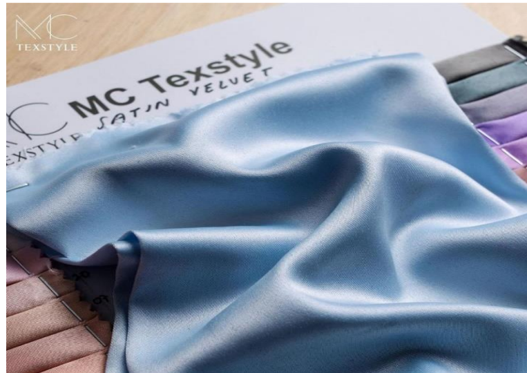
Gambar 4. 7 Bahan Satin

Bahan satin ini halus, licin, dan halus, namun juga nyaman dan mudah dipakai. Bahannya yang ringan dan tidak panas memberikan kenyamanan lebih. Selain itu, bahan satin memiliki sedikit kilau sehingga terlihat lebih elegan saat dikenakan