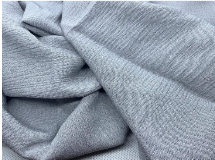
Gambar 4. 9 Bahan Crinkle