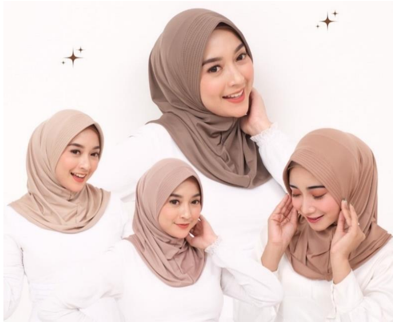
Gambar 4. 17 Hijab Sporty

Dari hijab segi empat, hijab motif, instan dan pashmina, Meskipun Para mahasiswi ini ingin berekspresi dan tampil beda dengan mengenakan berbagai jenis dan gaya hijab, namun mereka juga tidak ingin merasa terasing dari pergaulan kelompoknya. Ketika mahasiswi di sekitarnya mengenakan hijab yang dimodifikasi, itu membangkitkan rasa ingin tahu mereka untuk mengenakannya juga. Orang tampaknya perlu menjadi sosial dan individu pada saat yang sama, dan mode dan pakaian berfungsi sebagai teknik untuk menegosiasikan berbagai tujuan atau tuntutan yang kompleks (Barnard, 2011: 17). Sebab, selain butuh pembeda, manusia juga ingin menyesuaikan diri dengan lingkungannya. Ini adalah kebutuhan manusia yang dapat dipenuhi oleh fashion (dalam contoh ini, dengan mengenakan hijab).