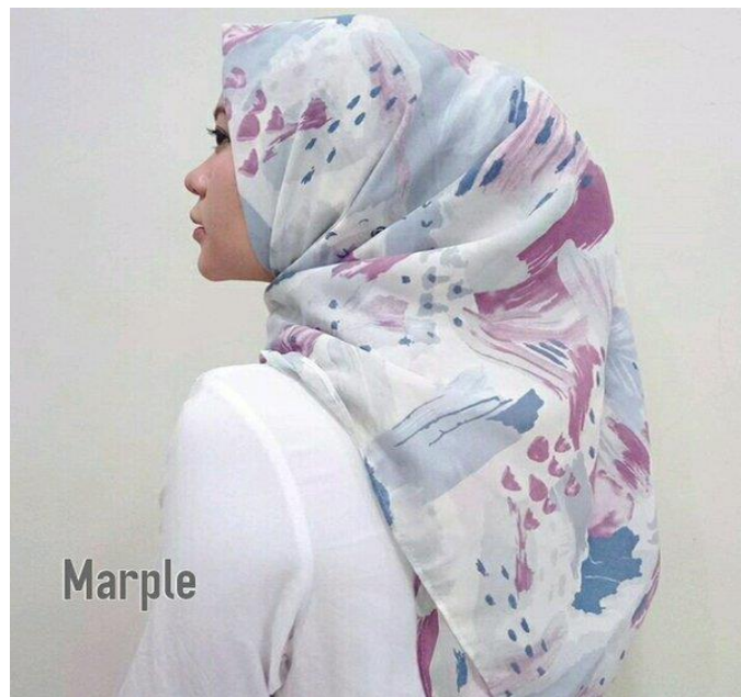
Gambar 4. 13 Motif Abstrak

Macam-macam trend fashion hijab dikalangan mahasiswa