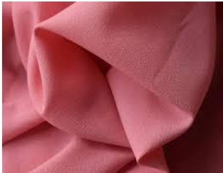
Gambar 4. 3 Diamond Crepe

Jenis kain hijab segi empat yang pertama yaitu diamond crepe. Jenis kain ini memiliki ciri khas yang melar atau lentur, tekstur yang kasar berpasir, dan ringan. Karena bahannya yang ringan, hijab yang menggunakan bahan ini akan jatuh saat dipakai, hijab segi empat dengan bahan diamond crepe ini tersedia dalam berbagai macam warna. Mulai dari warna yang tegas, cerah, hingga warna lembut. Selain banyak digunakan pada hijab segi empat, bahan ini juga kerap dibuat menjadi hijab khimar, pashmina, atau model-model lain yang tak kalah menarik.