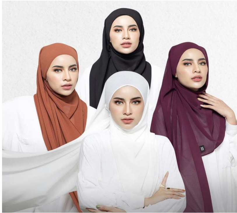
Gambar 4. 15 Hijab Pashmina