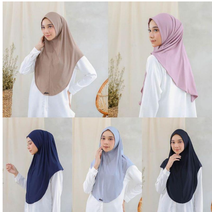
Gambar 4. 16 Hijab Instan