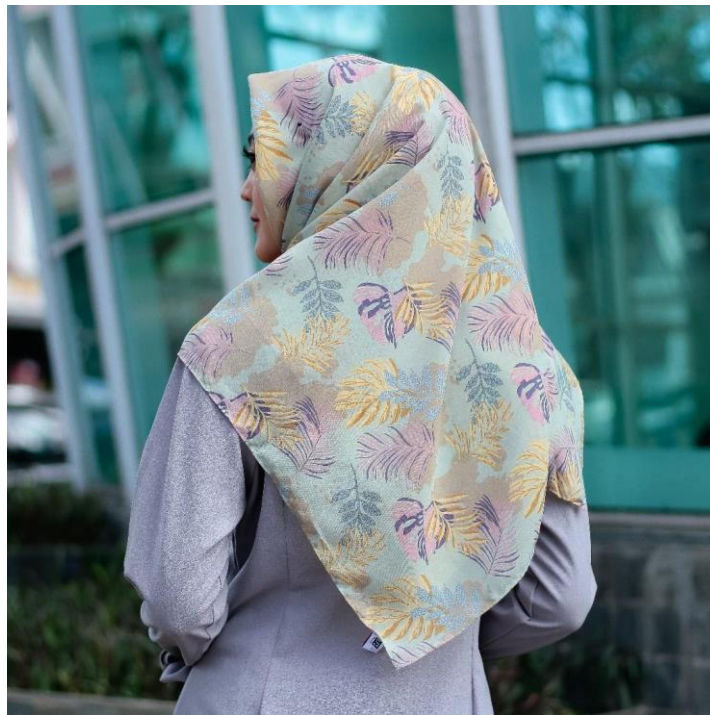
Gambar 4. 12 Motif Paisley