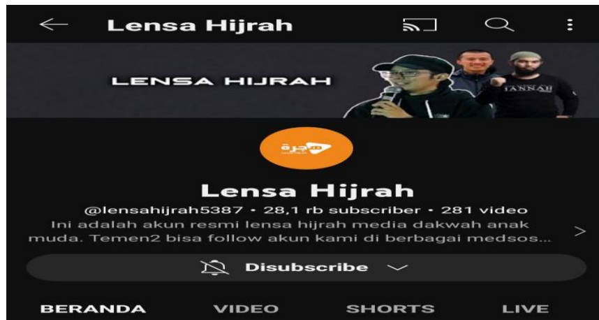
Gambar 1.

Media sosial youtube sangat banyak diminati oleh anak-anak muda milenial pada era sekarang ini. Dan tidak menutup kemungkinan orang tua juga pasti menyukai youtube, karna cepat dan efisien dalam mencari informasi yang diinginkan. Youtube juga sangat membantu untuk para pendakwah dalam menyebarkan ajaran agama Islam, agar dapat dilihat seluruh manusia di dunia. Hadirlah channel youtube dengan name account Lensa Hijrah saat ini memiliki subscriber berkisar 28,1 ribu. Subscriber ini dapat terus bertambah seiring berjalannya waktu. Dalam deskripsi channel tertulis “Ini adalah akun resmi Lensa Hijrah media dakwah anak muda. Teman – teman bisa follow akun kami di berbagai media sosial yang ada seperti IG, Fb, Tik tok, Snak Video, Hello, Likee, Cocofun, dan telegram”.