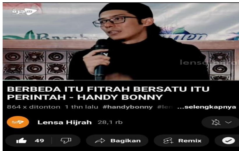
Gambar 4.

Video dakwah dengan judul Mewakili Perasaanmu Part 2 ini sudah pasti kelanjutan dari video sebelumnya. Berdurasi 42 menit 09 detik, yang ditonton sebanyak 15 ribu kali. Dalam video ini ceramah yang berisikan lanjutan tentang perasaan isi hati, memegang teguh keimanan, tetap beribadah kepada Allah swt. dan serius dalam hubungan. Beliau membimbing dalam membaca ayat suci Al-Qur'an dan ikuti para mad'u . Serta diselengi candaan ringan untuk para mad'u .