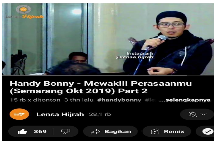
Gambar 3.

Video dakwah diatas berjudul Mewakili Perasaanmu Part 1 memiliki durasi 29 menit 17 detik yang diunggah pada tanggal 8 Oktober 2019. Video ini ditonton sebanyak 24 ribu kali. Lokasi dalam video ini di Masjid An-Nuur kota Semarang. Gaya busana beliau gaul tetap syar'i dan sarungan. Dalam video ini ceramah yang disampaikan tentang perasaan isi hati dan memegang teguh keimanan.