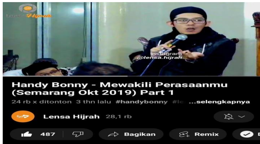
Gambar 2.

Video dakwah diatas berjudul Mewakili Perasaanmu Part 1 memiliki durasi 29 menit 17 detik yang diunggah pada tanggal 8 Oktober 2019. Video ini ditonton sebanyak 24 ribu kali. Lokasi dalam video ini di Masjid An-Nuur kota Semarang. Gaya busana beliau gaul tetap syar'i dan sarungan. Dalam video ini ceramah yang disampaikan tentang perasaan isi hati dan memegang teguh keimanan.