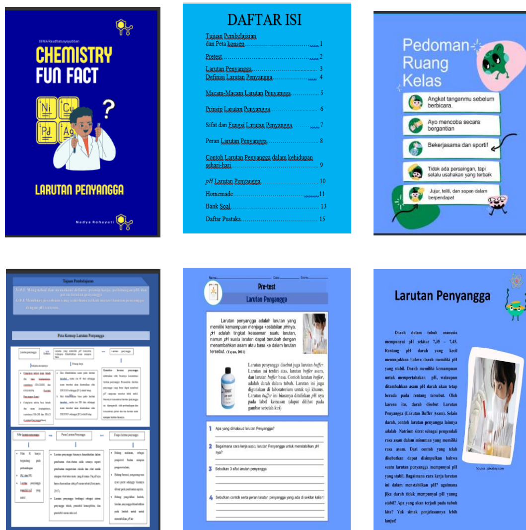
Gambar 4.1 Pocket Book (Bagian Cover, Daftar Isi, Pretest dan Apersepsi)

Tampilan pocket book dibagi menjadi empat bagian yang dapat dilihat pada Gambar 4.1 s/d 4.4. masing-masing bagian yang ada di pocket book dibuat menggunakan bantuan Aplikasi Canva dan Microsoft Word. Pocket book ini dibuat sebagai sumber belajar yang akan digunakan dalam pelaksanaan model pembelajaran TAI. Penjelasannya yang ringkas dan memuat animasi membuat pembaca tertarik untuk membacanya.