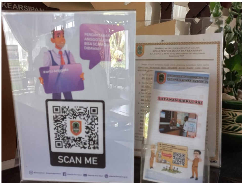
GAMBAR 4.2 Pendaftaran Anggota Online

“kemudahannya missal seperti absen tinggal scan barcode saja dan pendaftaran anggota juga online”