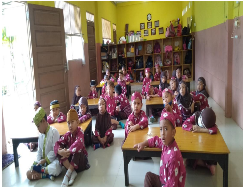
Gambar 8. Suasana belajar di sekolah TK IT Anak Sholeh Baitussalam