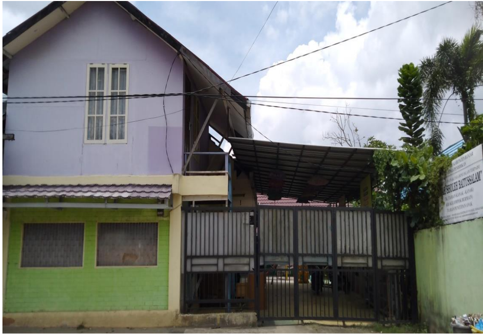
Gambar 5. Foto tampak depan TK IT Anak Sholeh Baitussalam