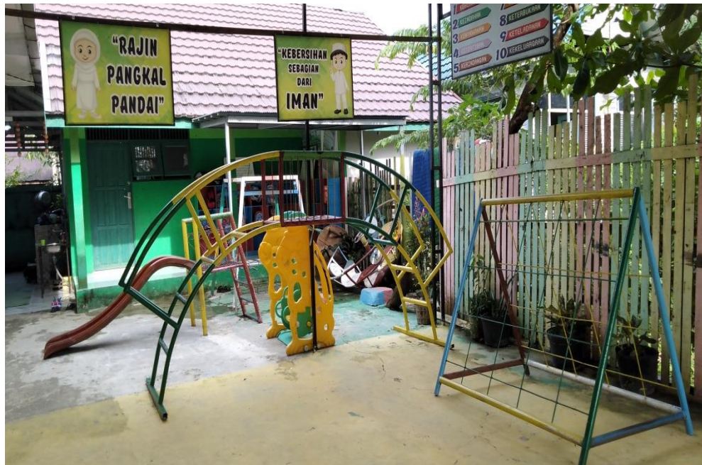
Gambar 7. Area bermain sekolah TK IT Anak Sholeh Baitussalam