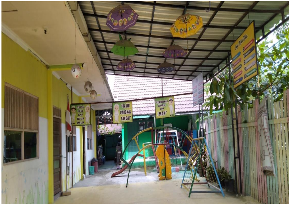
Gambar 6. Lingkungan sekolah TK IT Anak Sholeh Baitussalam