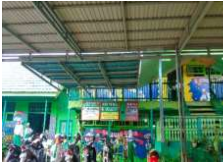
Gambar 1. MI Nor Rahman