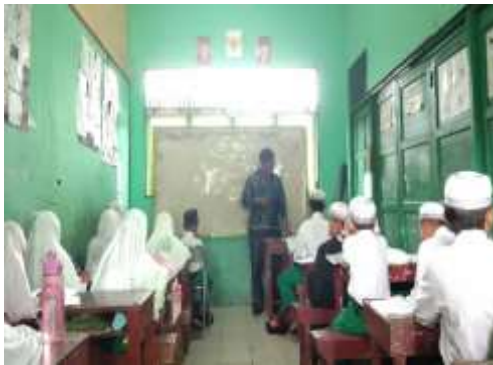
Gambar 3. Observasi kedua