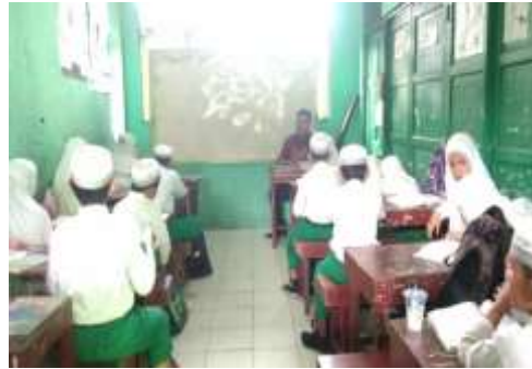
Gambar 2. Observasi pertama guru menjelaskan materi