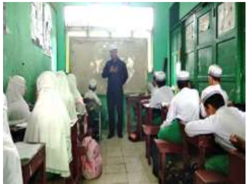
Gambar 4. Observasi ketiga