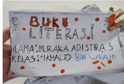
Gambar 4.12 Buku Literasi milik siswa kelas IV

Pelaksanaannya sendiri tergantung wali kelas masing-masing. Berikut pemaparan ust. Fitriyani Cahya selaku wali kelas IV Abu Ubaydah bin Al-zarrah terkait Buku Literasi.