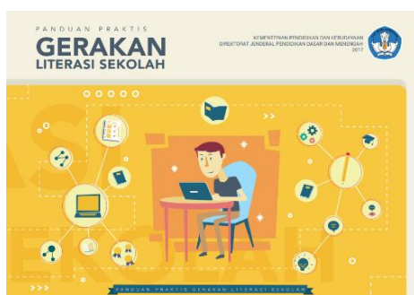
Gambar 4.4 Buku Panduan Praktik oleh GLN Kemendikbud.