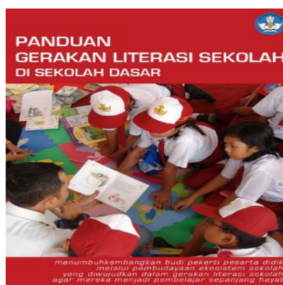
Gambar 4.6 Panduan Gerakan Literasi Sekolah di SD

Sebagai upaya sekolah dalam memaksimalkan perencanaan sudut baca, maka seluruh kelas serentak dilakukan pembaharuan perencanaan kembali dengan harapan agar program terus berjalan dan tidak putus sampai disitu mengingat tujuan dibentuknya sudut baca sendiri adalah karena ingin menjadikan buku sebagai teman siswa saat kapanpun disekolah, didalam maupun diluar kelas.