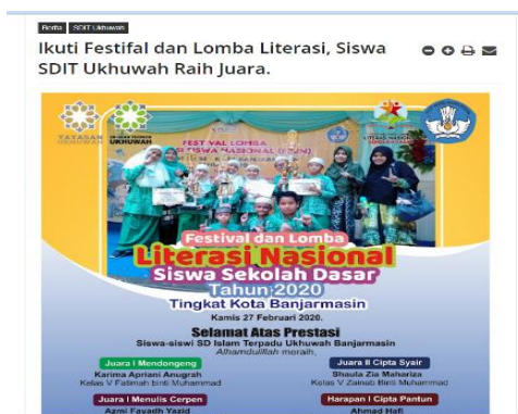
Gambar 4.19 Prestasi Literasi Nasional SDIT Ukhuwah Banjarmasin.

Dan juga, lambat laun literasi baca tulis siswa mulai membudaya dibuktikan dengan beberapa prestasi salah satunya pada Festival Lomba Literasi yang dimenangkan oleh SDIT Ukhuwah Banjarmasin tahun 2020 sebagaimana hasil observasi peneliti pada wesbsite SDIT Ukhuwah Banjarmasin