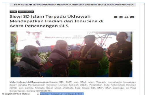
Gambar 4.2 Peresmian GLS di SDIT Ukhuwah oleh walikota, Ibnu Sina.

Selanjutnya, di tahun 2017 merupakan tahun dimana pelatihan Class Management kembali diadakan. Dalam pelatihan ini, mentor kembali menyuguhkan materi tentang keterampilan tenaga didik dan manajemen kelas yang dibutuhkan dalam keberlangsungan belajar mengajar. Dalam materi tersebut tidak terlepas dari bagaimana caranya meningkatkan literasi baca tulis melalui program yang dibuat terkhusus Sudut Baca.