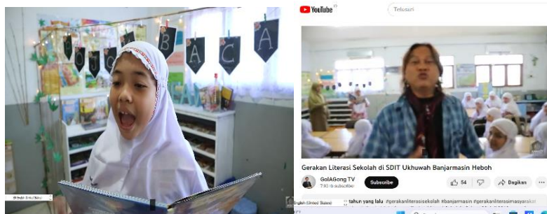
Gambar 4. 18 Kegiatan 15 menit membaca (bercerita) oleh siswa kelas IV pada kunjungan GOL A Gong.

Dan juga, lambat laun literasi baca tulis siswa mulai membudaya dibuktikan dengan beberapa prestasi salah satunya pada Festival Lomba Literasi yang dimenangkan oleh SDIT Ukhuwah Banjarmasin tahun 2020 sebagaimana hasil observasi peneliti pada wesbsite SDIT Ukhuwah Banjarmasin