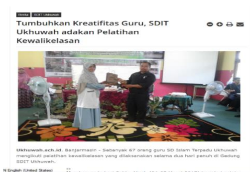
Gambar 4.3. Class Management Kewalikelasan Tahun 2017.

Atas hasil pada pelatihan yang dilaksanakan, kepala sekolah menyampaikan bagaimana pembaharuan dalam perencanaan sudut baca pada saat rapat tahun ajaran 2017 dengan membedah isi pedoman Gerakan Literasi Sekolah dan mengimplementasikannya ke dalam program sekolah khususnya sudut baca kelas. Hal ini dipaparkan ust. Jamilah selaku kepala sekolah pada saat wawancara berlangsung: