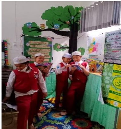
Gambar 4.10 Siswa kelas IV sedang membaca di area Sudut Baca

Adapun berdasarkan hasil observasi peneliti terkait keadaan sudut baca yang di buat semenarik dan menyenangkan mungkin untuk membuat murid betah memanfaatkan area sudut baca sebagai area dalam berliterasi baca tulis.