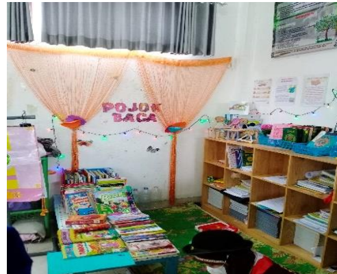
Gambar 4.15 Kondisi Sudut Baca di kelas IV Ummu Habibah