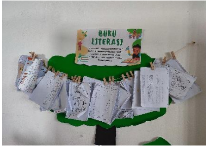
Gambar 4.11 Tampilan Buku Literasi

Buku Literasi ini dilakukan selama sebulan sekali dengan pengerjaan 2 kali seminggu dan dikumpulkan setiap akhir bulan lalu ditempel di area sudut baca sebagai tambahan koleksi dari siswa sebagaimana hasil observasi peneliti di area sudut baca kelas IV SDIT Ukhuwah Banjarmasin.