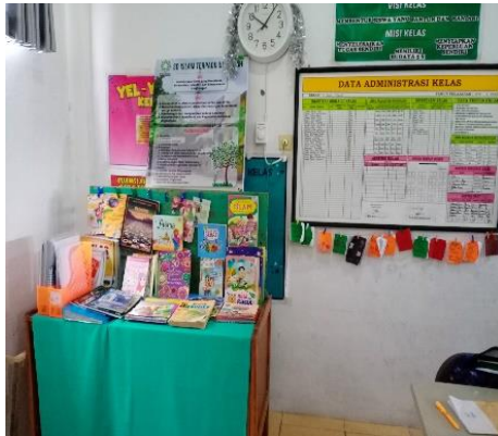
Gambar 4.14 Kondisi Sudut Baca di kelas di kelas IV Ummu Salamah

Berikut tampilan sudut baca kelas IV SDIT Ukhuwah berdasarkan hasil observasi peneliti.