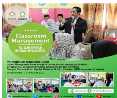
Gambar 4.9 Classrom Management tentang Manajemen Kelas tahun 2020