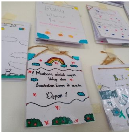
Gambar 4.7 Koleksi Murid di Sudut Baca

Hal ini dibuktikan dengan observasi yang peneliti lakukan bahwa Buku Literasi ini gunanya agar dapat melatih kemampuan membaca dan menulis anak ke sebuah buku mini yang dibuat lalu dihias optional oleh siswa.