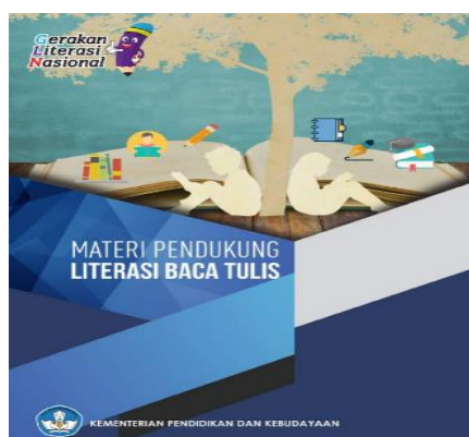
Gambar 4.5 Materi Pendukung Literasi Baca Tulis oleh Kemendikbud