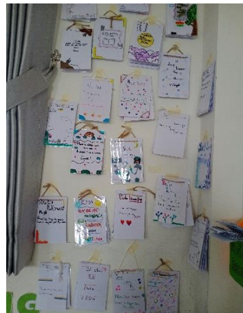
Gambar 4.8 Buku Literasi

Atas usulan dari pihak manajemen kelas, maka buku literasi diadakan serentak untuk setiap kelas. Namun, hal ini dilaksanakan untuk kelas atas terlebih dahulu yakni kelas IV, V, dan VI untuk menjadi percobaan awal selama 1 bulan. Hal ini sesuai dengan penjelasan ust. Jamilah selaku kepala sekolah.