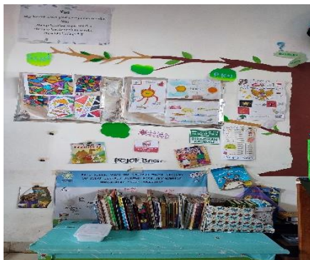
Gambar 4.16 Kondisi Sudut Baca di kelas IV Khalid bin Walid