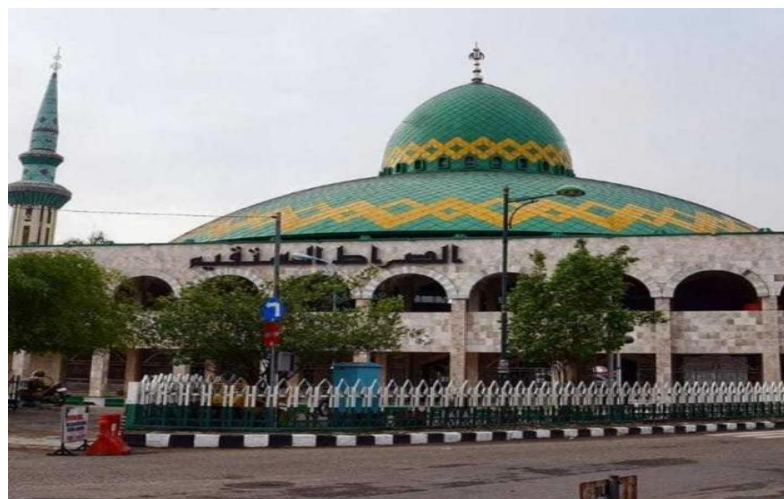
Gambar 4.2 Masjid Agung Ash Shirathal Mustaqim di renovasi tahun 2012