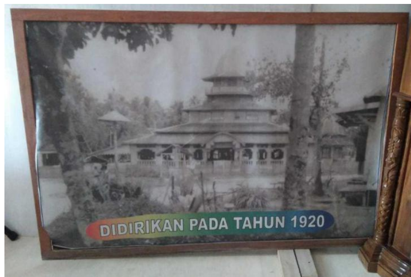
Gambar 4.1 Tahun Berdirinya Masjid Ash Shirathal Mustaqim Tanjung

kategori Masjid Agung yang terletak di Jl. Ratu Zaleha Tanjung Tabalong Rt. 03. Luas tanah masjid ini 2500m 2 , luas pembangunan 1600m 2 , pengalihan hak pengusahaan tanah. Masjid ini memiliki 1000 jamaah, 4 marbot/pembersih, 3 imam dan 5 muadzin.