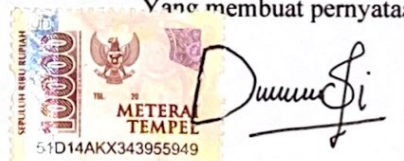
Dessy Kemala Dewi