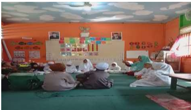
Gambar. 4.2.3. Kegiatan Pengenalan Kalimat Thayibah (CDF.RMNU02.01) 13