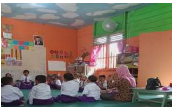
Gambar. 4.2.2 Kegiatan Pembaca Asmaul Husna (CDF.RMNU01.02) 9

Di RAMMNU, memiliki kegiatan setiap pagi mengenai pembacaan hafalan doa-doa, surah pendek, serta Asmaul Husna, terkadang juga ada hafalan mengenai hadist pendek kepada anak. Ini merupakan bentuk kegiatan keagamaan yang sesuai dengan lembaga pendidikan RA, yaitu lebih menonjolkan sisi keagamaan sebagai ciri khas lembaga pendidikan RA. Berdasarkan observasi yang dilakukan peneliti mengenai kegiatan pagi anak-anak di RAMMNU, disini Ibu WU terlihat aktif membimbing anak dalam kegiatan keagamaan pagi (CORMNU1.2) 8 , seperti yang terlihat pada gambar berikut.