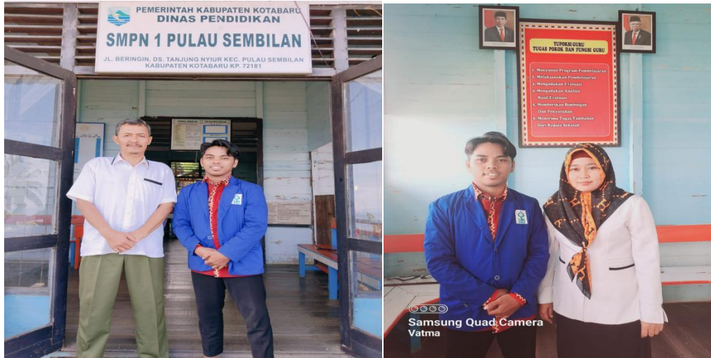
Foto bersama Kepala Sekolah dan Guru BK