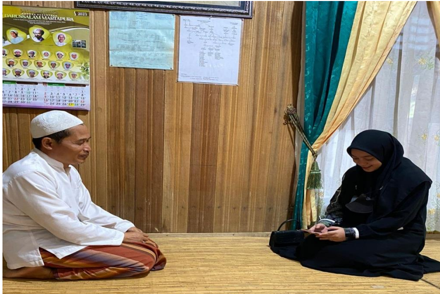
Wawancara Bersama Ketua/pimpinan Yayasan Al-Ittihad