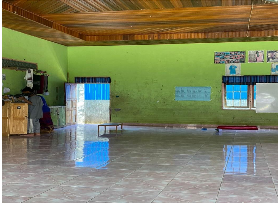
Asrama Yayasan Al-Ittihad Tampak Dalam