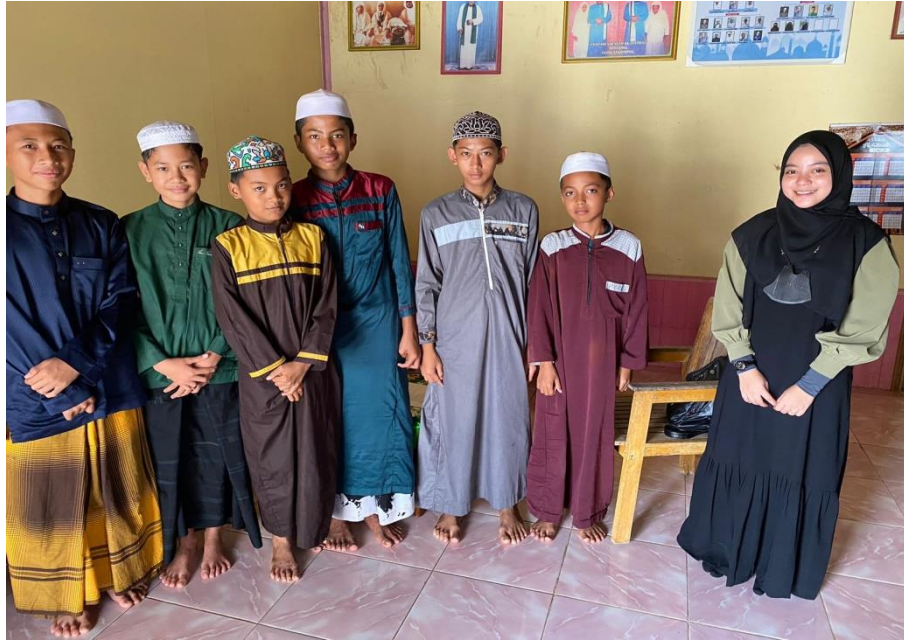
Bersama santri Yayasan Al-Ittihad