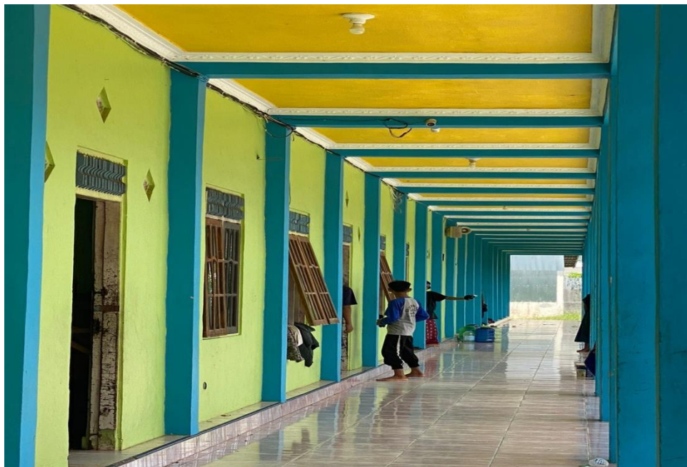
Asrama Yayasan Al-Ittihad Tampak Luar