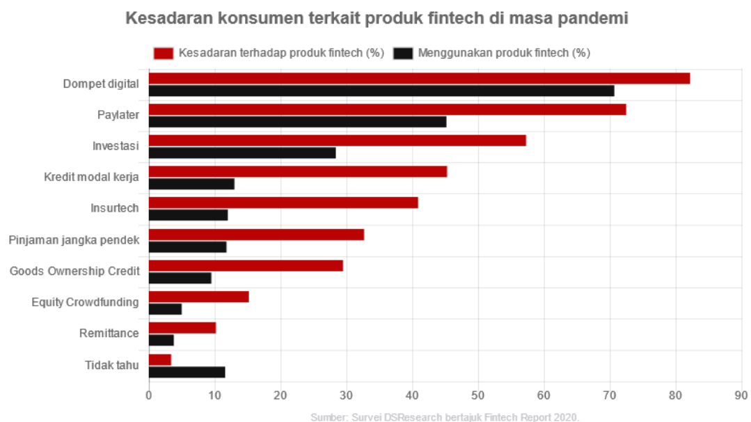
Gambar 1.1 Persentase Produk Fintech 2020