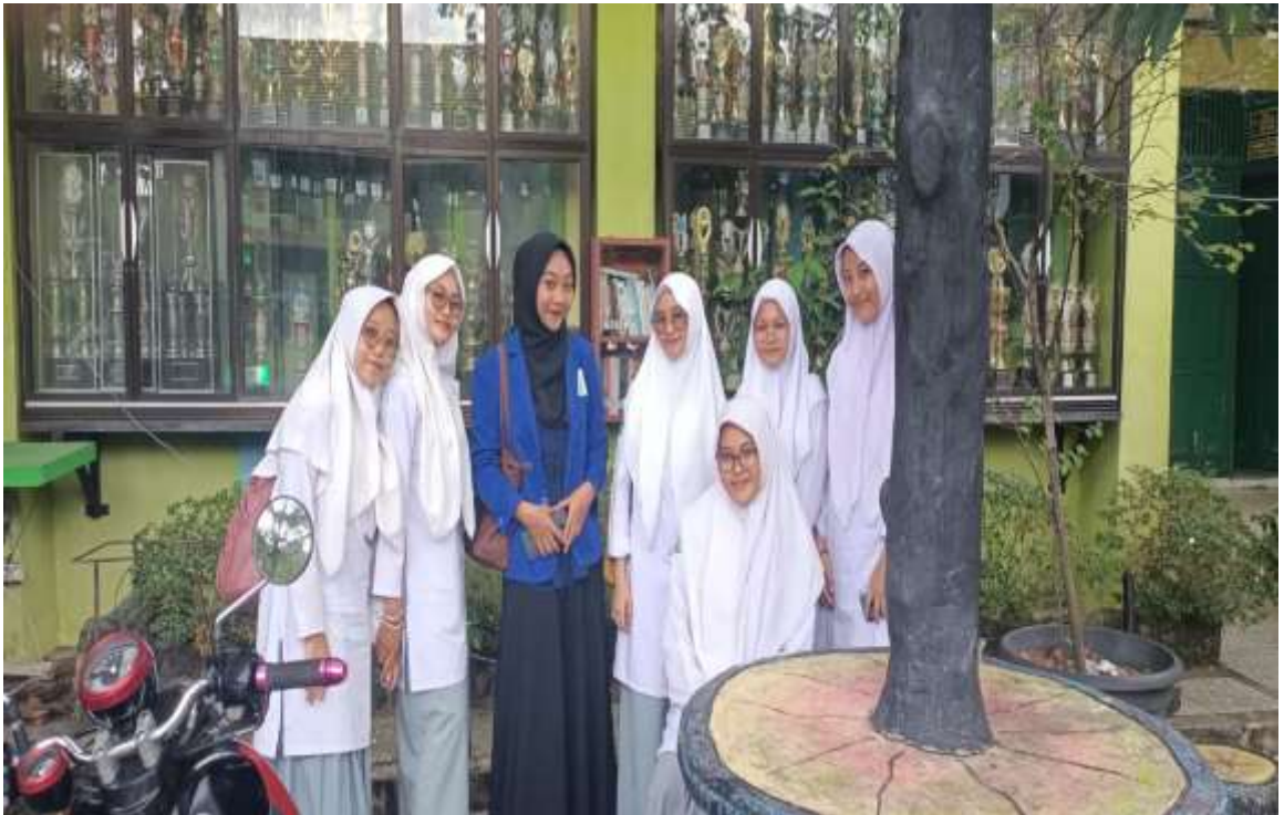
Gambar 2 Wawancara Dengan Guru Bidang Studi Man 3 Banjarmasin