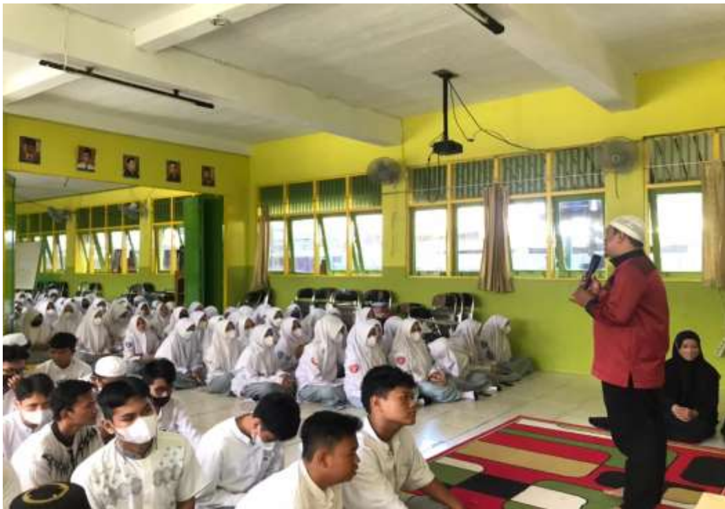
Gambar 4 Kegiatan Muroja'ah Siswa MAN 3 Banjarmasin