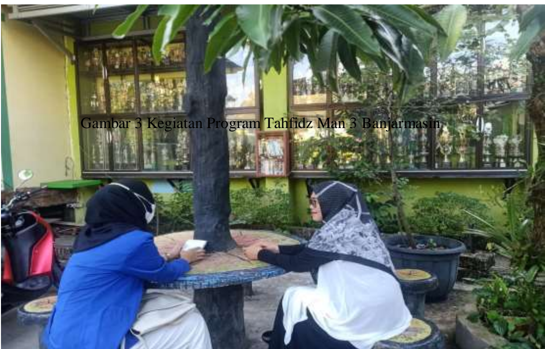
Gambar 3 Kegiatan Program Tahfidz Man 3 Banjarmasin