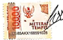
Muhammad Amin Rais

Banjarmasin, 23 Juni 2023 Yang Membuat Pernyataan,