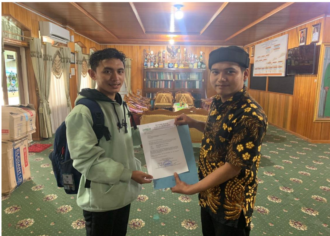
Gambar 4 penerimaan surat selesai riset di masjid sabilal muhtadin banjarmasin