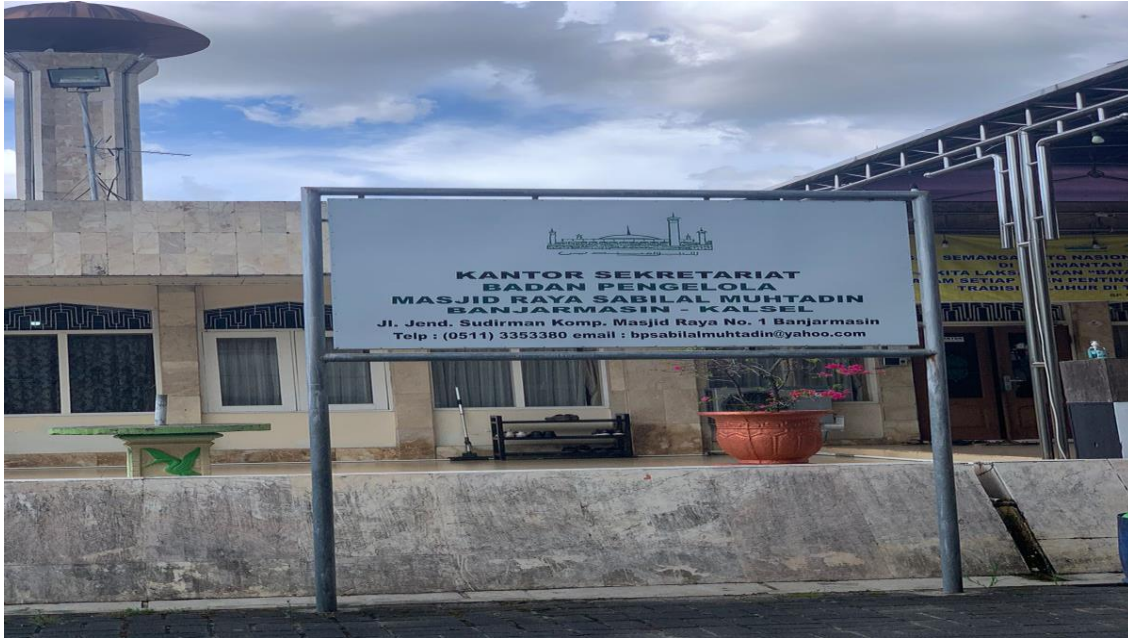
Gambar 3 kantor sekretariat badan pengelola masjid sabilal muhtadin