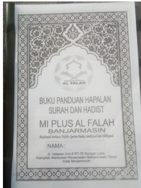
Gambar 4.1 Buku Panduan Hafalan Surah dan Hadist siswa

Sebelum menjelaskan secara rinci penerapan reward yang diberikan berikut ini beberapa tampilan buku panduan hafalan Al-Qur'an Siswa.