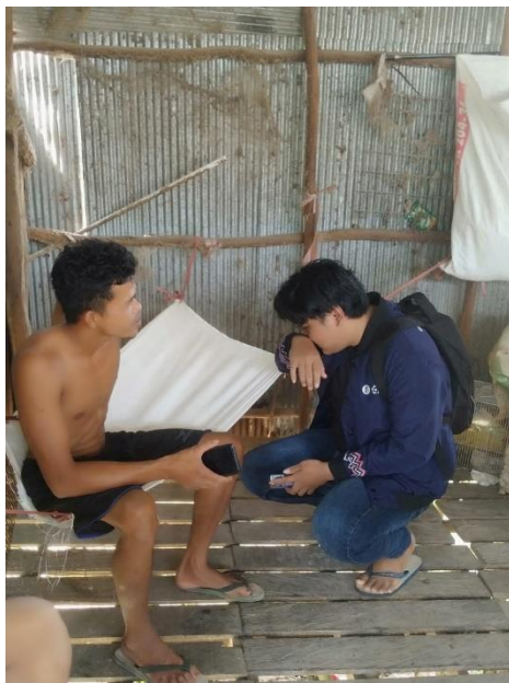
Saat mewawancarai para pekerja di peternakan ayam petelur