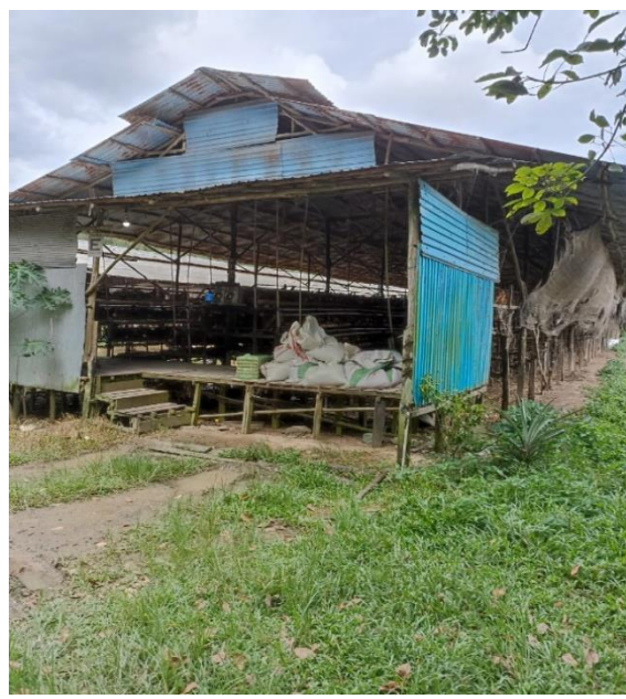
Suasana peternakan ayam petelur tampak dari depan dan dari dekat