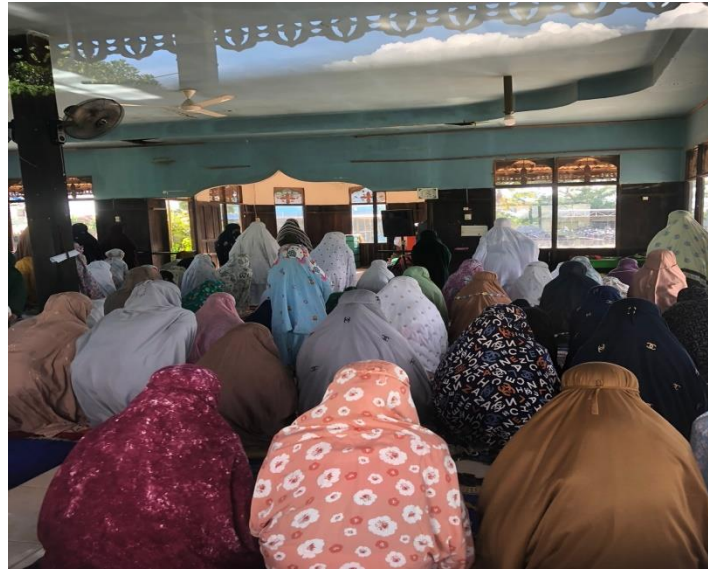
Foto ruang kelas, aula dan masjid Pondok Pesantren Ishlahul Aulad