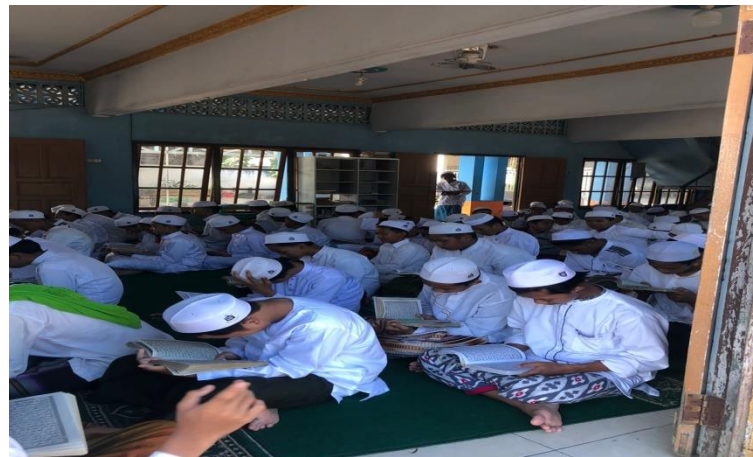
Foto santri putra putri pada saat melaksanakan solat zuhur berjamaah