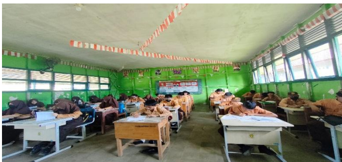
Gambar tes uji coba instrumen soal di kelas VIIIA