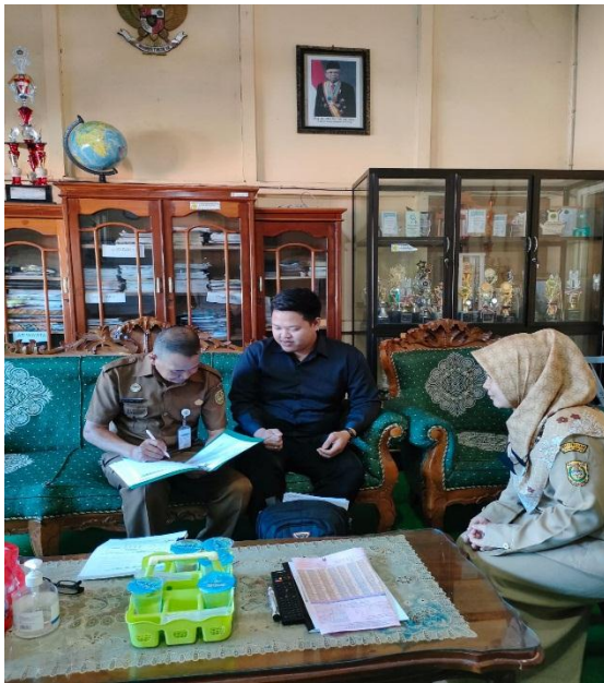
Gambar ketika izin kepala sekolah sekaligus wawancara guru matematika