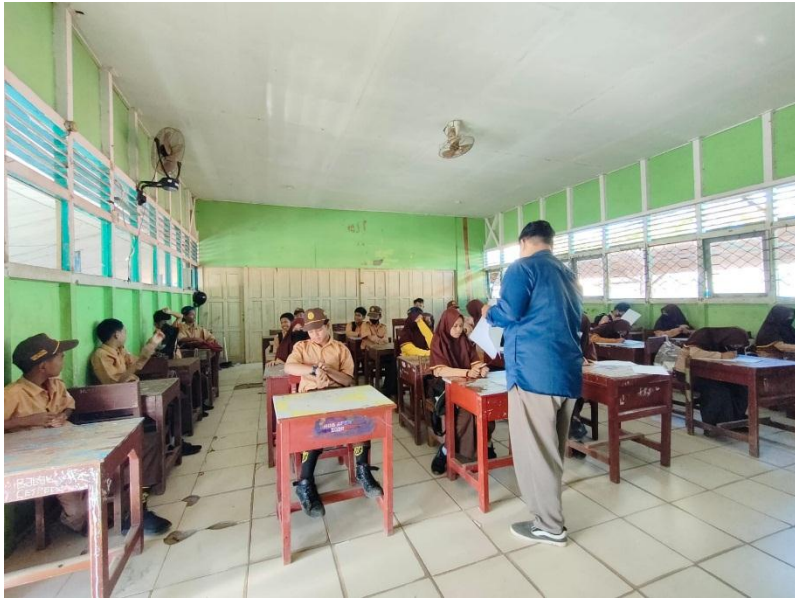
Gambar tes pengujian soal di kelas eksperimen