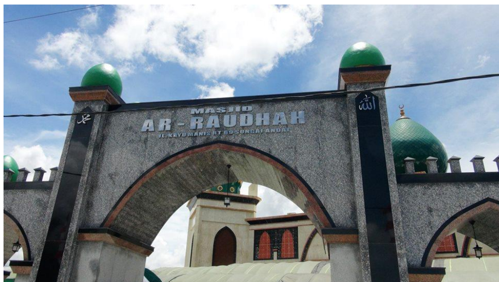
Gambar 3.2 Mesjid Ar-Raudah