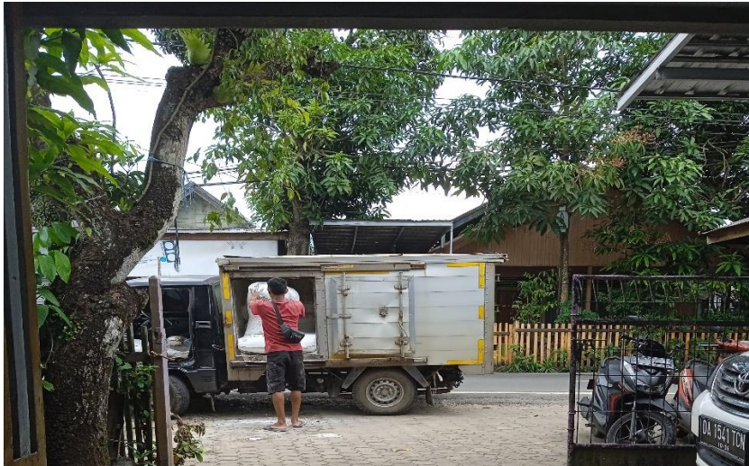
(Pengantaran Tapioka dari Agen)