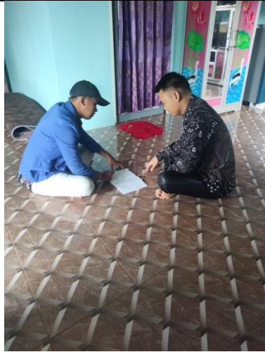
Wawancara bersama M F