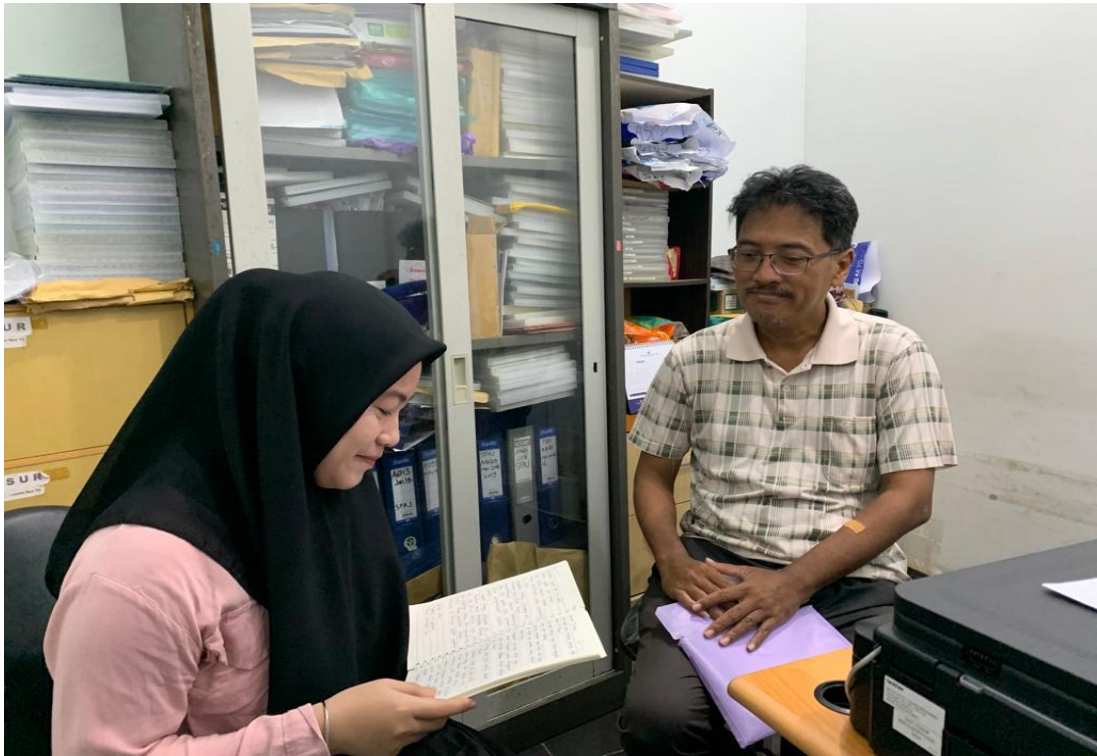
Foto bersama para agen Asuransi Allianz Banjarmasin