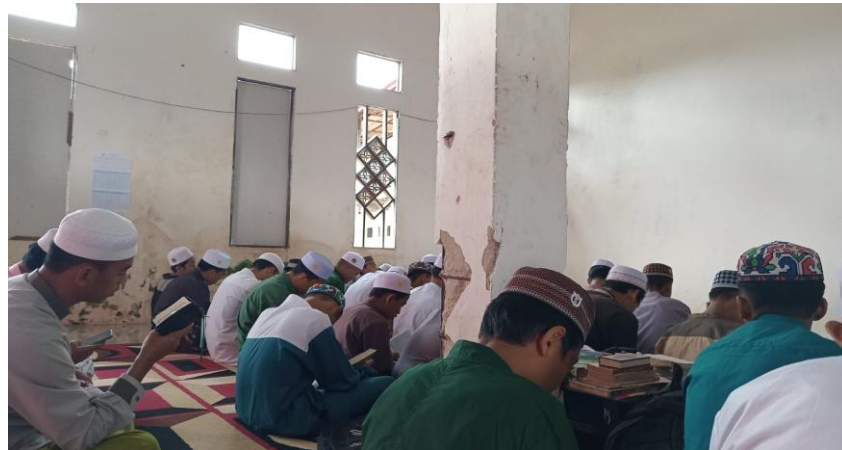
Gambar 4.4 Kegiatan Awal Murojaah

Kegiatan murojaah ini dapat dilihat pada gambar berikut ini: