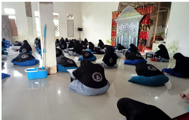
Gambar 4.6 Metode Kitabah

Metode kitabah ini dilaksanakan setelah santri selesai menyetor hafalannya kepada guru atau sembari menunggu teman yang lainnya menyetorkan hafalan, maka yang telah selesai menyetor mengambil kertas HVS yang telah disediakan guru kemudian menuliskan hapalan yang sudah santri hafal. Peneliti mengamati pada saat santri menuliskan ayat-ayat, huruf demi huruf santri mampu menulis dengan cepat sesuai dengan ayat yang santri hafal pada hari itu. 12