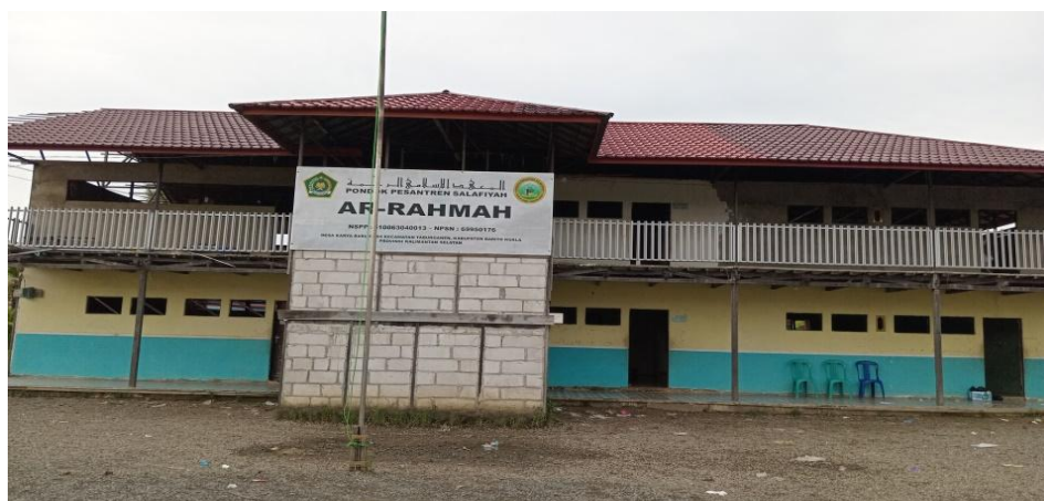
Gambar 4.1 Lokasi Penelitian

Dengan demikian dari IKSD Al Tab membentuk Pondok Pesantren yang sekarang diberi nama Ar-Rahmah, tahun ajaran pertama Pondok Pesantren Ar-Rahmah menumpang di Madrasah Diniyah Al-mujahiddin dalam proses belajar mengajar, seiring berjalannya waktu mulai timbul kepercayaan masyarakat terhadap IKSD terbukti salah satu warga desa Karya Baru yaitu haji Tambrin (H. Ambrin) RT. 04 menghibahkan tanah keluarga beliau untuk dibangun pondok pesantren yang terletak di RT 04 pada tahun 2005, Tepatnya pada 9 Syawal 2005 dilakukan peletakan tongkat pertama pembangunan Pondok Pesantren Ar-Rahmah yang alhamdulillah sampai sekarang sudah bisa di tempati dari tahun ketahun alhamdulillah kemajuan semakin bagus sehingga tanggal 12 Juli 2011 Pondok Pesantren Ar-Rahmah direkomendasikan oleh kepala kantor agama Barito Kuala dengan status terdaftar dan alhamdulillah pada tanggal 15 Oktober 2014 dibuatkan kewenangan wajar pendidikan dasar dengan status terdaftar. 2