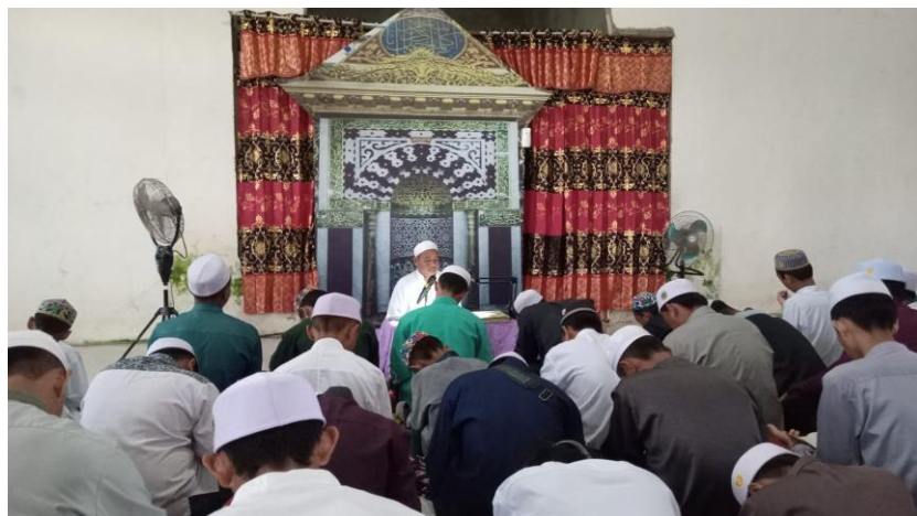
Gambar 4.3 Kegiatan Awal Membaca Dalail, Juz 30 dan Aqidatul Awam

Setelah selesai membaca dalail, juz 30, dan aqidatul awam baru dilaksanakan murojaah bersama, Sebelum memulai murojaah para santri dan santriwati terlebih dahulu membacakan surah Al-Fatihah, surah Al-Ikhlash, surah Al-Falaq dan surah An-nas yang dipimpin oleh pimpinan Pondok Pesantren Ar-Rahmah ataupun yang menggantikan beliau. Setelah pimpinan pondok dan santri membaca surah Al-Fatihah, Al-Ikhlash, Al-Falaq dan An-Nas kemudian dilanjutkan oleh para santri untuk murojaah hafalan-hafalan masing-masing yang sudah santri hafal dan yang akan disetorkan kepada guru halaqah masing-masing dihari itu. Kegiatan murojaah ini berlangsung dengan khusyu' dan tertib, santri dan santriwati tampak fokus kepada masing-masing hafalan yang mereka miliki. Adapun posisi duduk antra santri dan santriwati dipisah, untuk santri berada didepan sedangkan