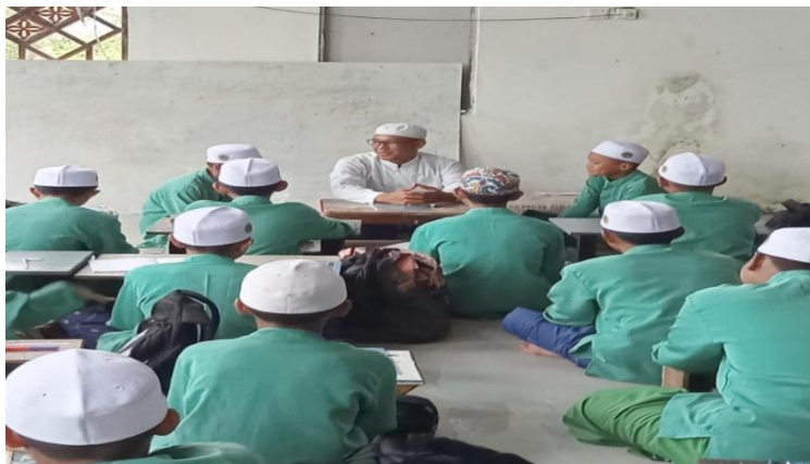
Gambar 4.5 Metode Wahdah

Kemudian peneliti mengamati lagi pada saat santri dan santriwati menyetor hafalan kepada guru semua santri membaca doa dan fatihah empat sebelum memulai kegiatan setoran hafalan, baru setelah itu guru memberikan sedikit humor candaan kepada santri dan santriwati yang akan menyetorkan hafalannya hal ini dilakukan guru agar santri dan santriwati rileks tidak tegang dalam menghafal al-Qur'an.