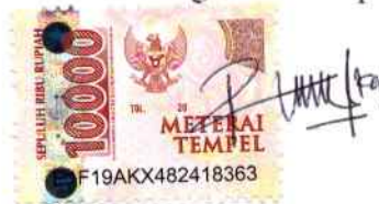
Nor Riska Awaliah

Banjarmasin, 24 Januari 2023 Yang membuat pernyataan,