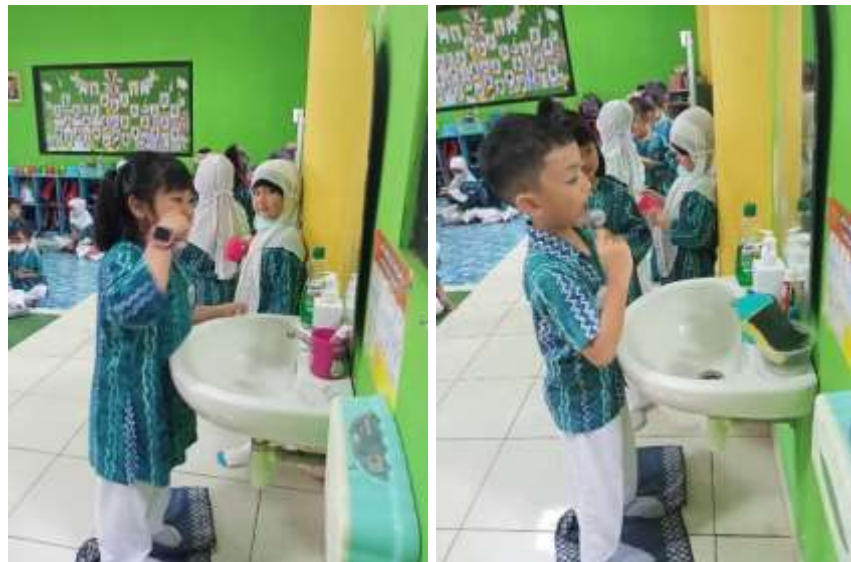
Gambar 4.20 Kegiatan Menggosok Gigi

masing anak. Di dalam kelas juga telah disediakan wastafel atau tempat untuk menggosok gigi.