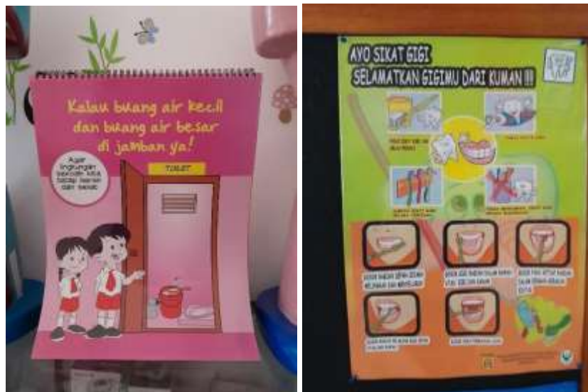
Gambar 4.28 Poster PHBS Buang Air di Jamban dan Gosok Gigi