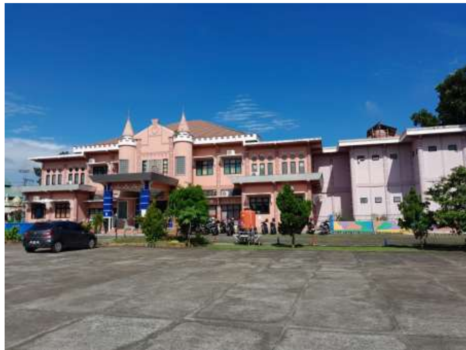
Gambar 4.1 Lokasi Penelitian

TK Negeri Idaman Banjarbaru juga merupakan lembaga pendidikan inklusif dan piloting pendidikan keluarga untuk tingkat Taman Kanak-Kanak di Kota Banjarbaru.