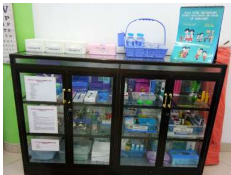
Gambar 4.15 Lemari Penyimpanan Alat Kesehatan UKS TK Negeri Idaman Banjarbaru

Jadi, fungsi pengenalan alat kesehatan ini bertujuan untuk menunjukkan kepada anak tentang bentuk nyata dari alat-alat kesehatan yang sebelumnya hanya dilihat melalui foto saja dan disampaikan melalui cerita menjadi terealisasi bentuk dari alat-alat kesehatan.