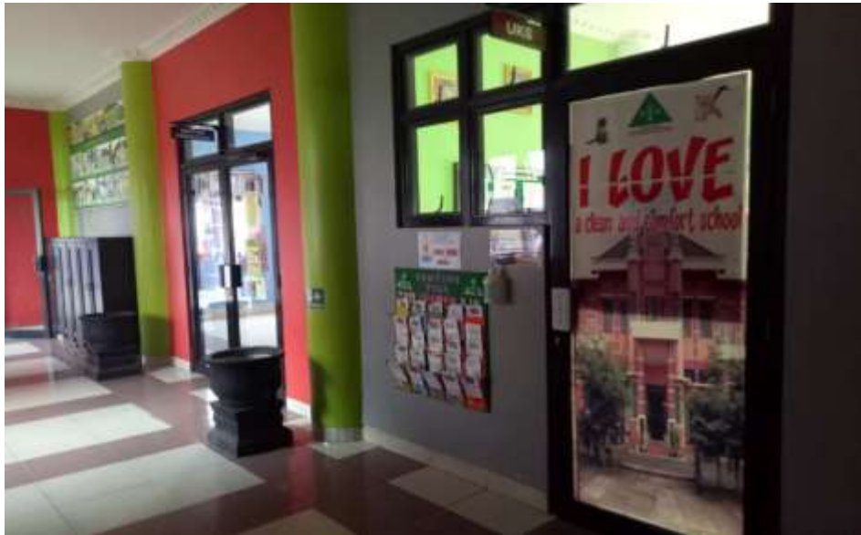
Gambar 4.6 Tampak Depan Ruang UKS TK Negeri Idaman Banjarbaru

berada di UKS, anak-anak yang berkunjung melakukan berbagai kegiatan mulai dari penyambutan anak-anak yang berkunjung, membacakan cerita, pengenalan alat-alat, praktik menggunakan alat kesehatan, dan pengenalan jenis-jenis obat. 2