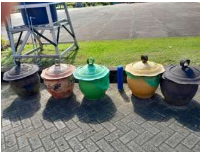
Gambar 4.23 Tempat Sampah di TK Negeri Idaman Banjarbaru