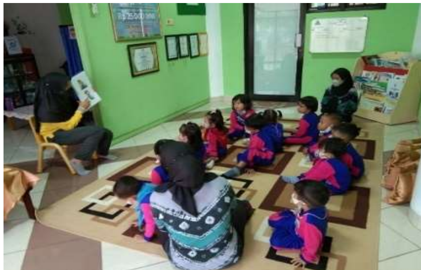
Gambar 4.10 Kegiatan Bercerita di UKS TK Negeri Idaman Banjarbaru

Setelah petugas UKS menyambut kedatangan anak-anak yang berkunjung, kegiatan berikutnya yaitu membacakan cerita tentang kebersihan dan kesehatan. Bercerita merupakan kegiatan sekaligus metode yang digunakan oleh petugas UKS kepada anak-anak dalam mengenalkan kebersihan dan kesehatan. Berikut ini foto kegiatan bercerita yang dilakukan di dalam UKS.