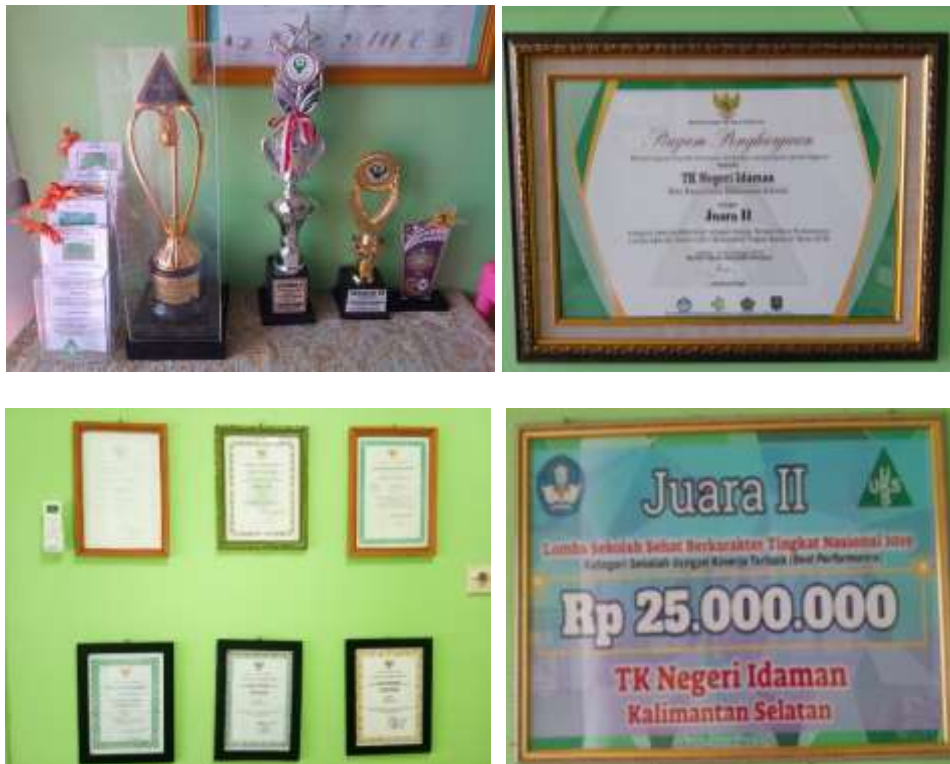
Gambar 4.19 Piagam Penghargaan UKS TK Negeri Idaman Banjarbaru

Berikut ini beberapa gambar piagam penghargaan predikat sekolah bersih dan sehat yang diraih oleh UKS TK Negeri Idaman Banjarbaru.