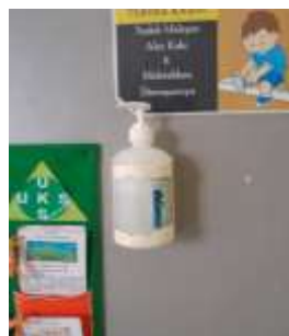
Gambar 4.9 Handsanitizer UKS TK Negeri Idaman Banjarbaru

Sebelum melaksanakan berbagai kegiatan, petugas UKS akan menyambut anak-anak dan guru yang akan melakukan kunjungan di UKS. Sebelum memulai kegiatan di UKS, anak-anak terlebih dahulu membersihkan tangan menggunakan Handsanitizer dan petugas UKS akan mengisi absen nama-nama anak yang berkunjung.