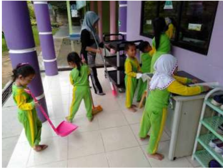
Gambar 4.21 Kegiatan Membersihkan Kelas