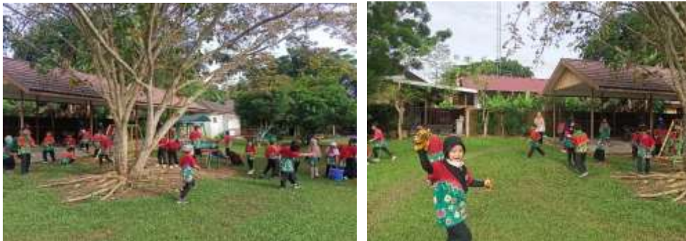
Gambar 4.4 Kegiatan Operasi Semut