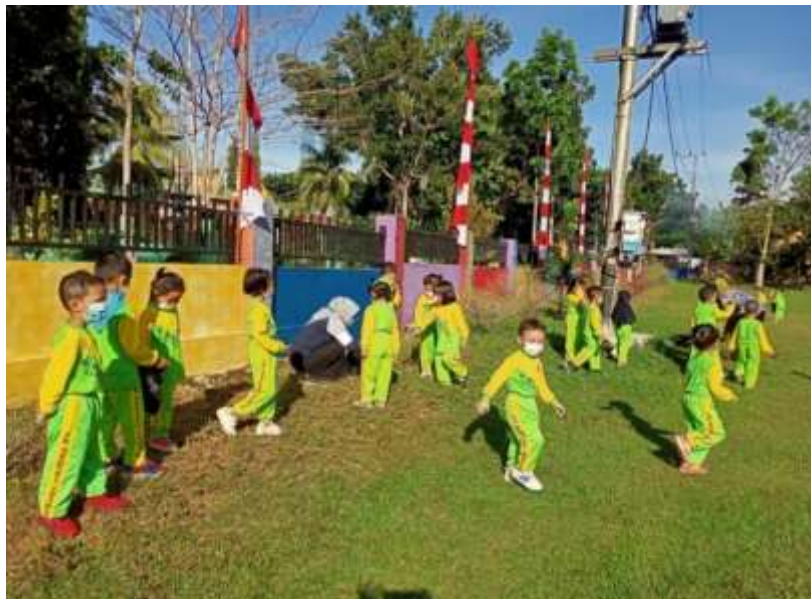
Gambar 4.5 Kegiatan Jum'at Bersih