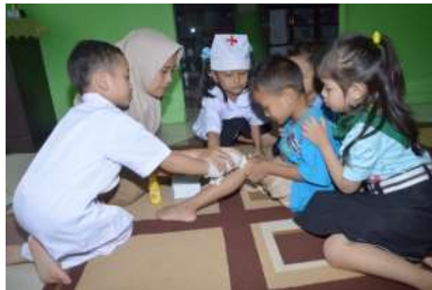
Gambar 4.26 Praktik Cara Mengobati Luka