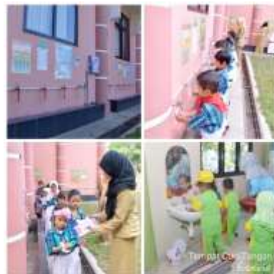
Gambar 4.22 Kegiatan Mencuci Tangan

Anak-anak TK Negeri Idaman Banjarbaru menerapkan pembiasaan mencuci tangan dengan sabun yang dilakukan pada saat sebelum maupun sesudah makan, melakukan kegiatan kebersihan lingkungan dan kegiatan lainnya.