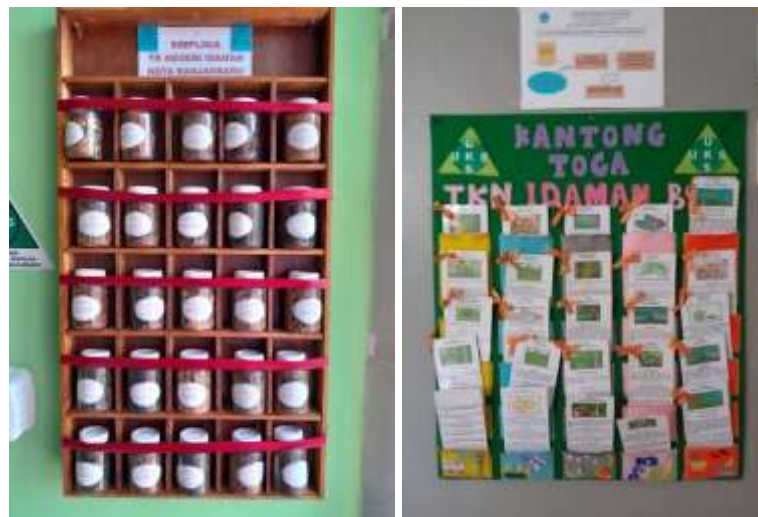
Gambar 4.12 Rempah-rempah Obat dan Modul Jenis Tanaman