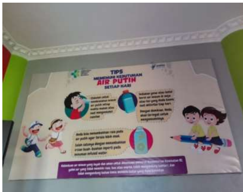
Gambar 4.29 Poster Anjuran Minum Air Putih