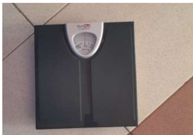
Gambar 4.13 Timbangan Berat Badan