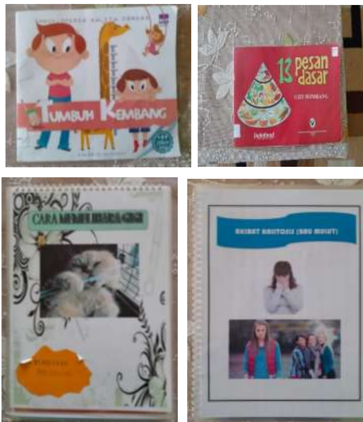
Gambar 4.24 Buku Cerita

Agar perilaku hidup bersih dan sehat dapat dilaksanakan dan diterapkan oleh anak-anak di TK Negeri Idaman Banjarbaru, para guru memberikan edukasi kepada anak-anak melalui metode bercerita. Adapun media yang digunakan untuk bercerita biasanya menggunakan buku-buku cerita yang dengan tema kebersihan dan kesehatan.. Berikut ini contoh buku cerita yang digunakan sebagai metode penyampaian perilaku hidup bersih dan sehat kepada anak-anak.