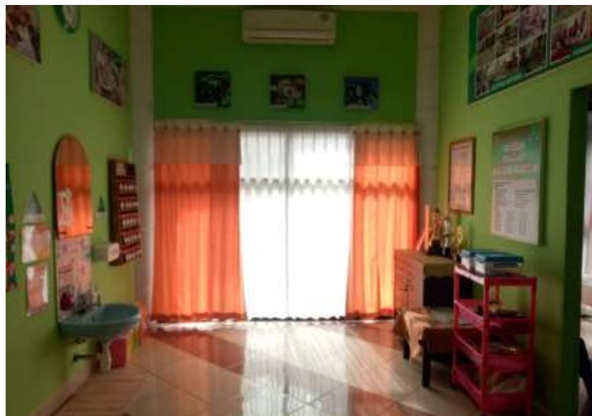
Gambar 4.7 Bagian Dalam Ruang UKS TK Negeri Idaman Banjarbaru