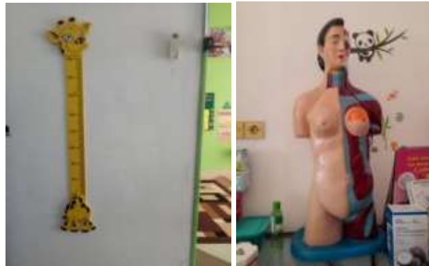
Gambar 4.11 Alat Ukur Tubuh dan Anatomi Tubuh Manusia