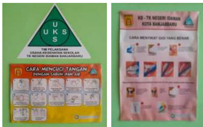
Gambar 4.27 Poster di ruang UKS

Poster merupakan media visual berupa gambar berupa kertas yang biasanya ditempel ditempat-tempat umum dan Lembaga-lembaga. Di TK Negeri Idaman Banjarbaru terdapat beberapa poster dengan gambar anjuran menjaga kebersihan seperti poster cara mencuci tangan, langkah-langkah menggosok gigi dan poster yang menyampaikan informasi-informasi seputar phbs. Menurut ibu T selaku guru kelompok B, metode pemanfaatan poster yang ada di TK Negeri Idaman dipasang guna menarik perhatian anak-anak, maka dari itu poster-poster yang ada di TK Negeri Idaman dibuat semenarik mungkin mulai dari tampilan gambar dan warna. Selain itu, menurut ibu T poster-poster biasanya ditempel ditempat-tempat yang banyak di kunjungi anak-anak, misalnya di tempat pencucian tangan, di dalam kelas, di toilet dan di dekat tempat pembuangan sampah. Berikut ini beberapa poster yang ada di TK Negeri Idaman Banjarbaru. 9