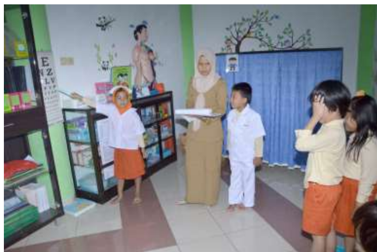
Gambar 4.18 Kegiatan Docil (Dokter Cilik)