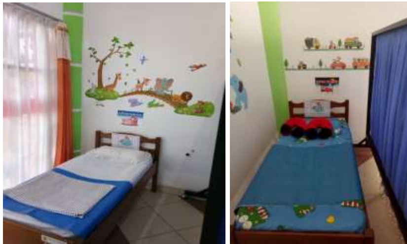
Gambar 4.8 Ruang Kamar UKS TK Negeri Idaman Banjarbaru

Berikut ini kegiatan-kegiatan yang dilakukan oleh anak-anak TK Negeri Idaman selama berada di UKS: