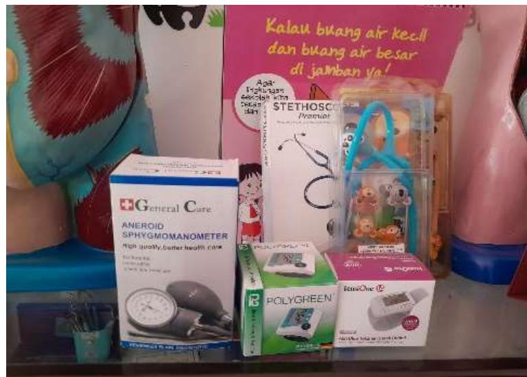
Gambar 4.14 Stetoskop dan Tensimeter