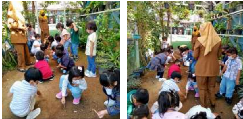
Gambar 4.25 Praktik Menanam Tanaman Obat dan Tanaman Hias