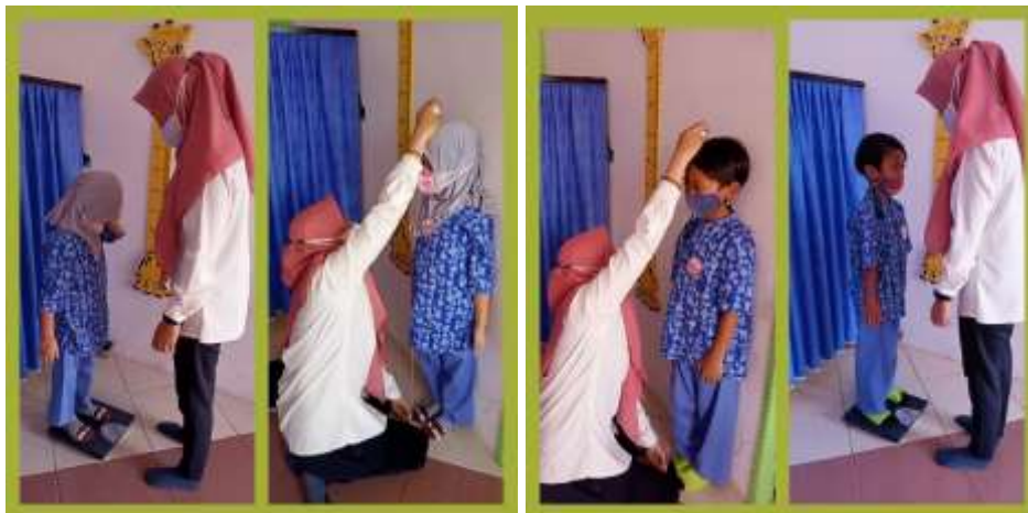
Gambar 4.16 Kegiatan Mengukur TB dan BB di UKS

Di dalam ruang UKS anak-anak juga melakukan kegiatan mengukur tinggi badan dan menimbang berat badan yang di lakukan oleh petugas UKS.