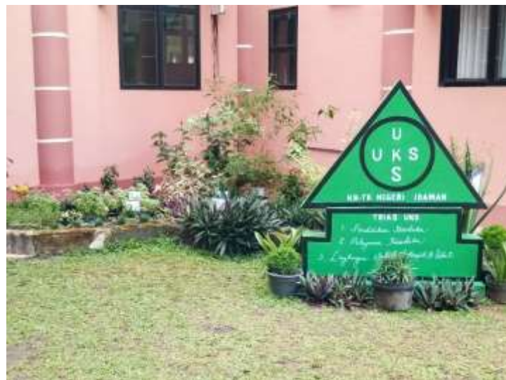
Gambar 4.3 Tugu Trias UKS

3) Pembinaan Lingkungan Sekolah Sehat. Sekolah mempunyai aturan tentang KTR, KTN, KTK. Mempunyai toilet yang layak, mempunyai sarana dan prasarana olahraga, mempunyai ruang UKS yang lengkap, ruang kelas sesuai standar nasional, halaman tempat bermain yang luas dan nyaman.