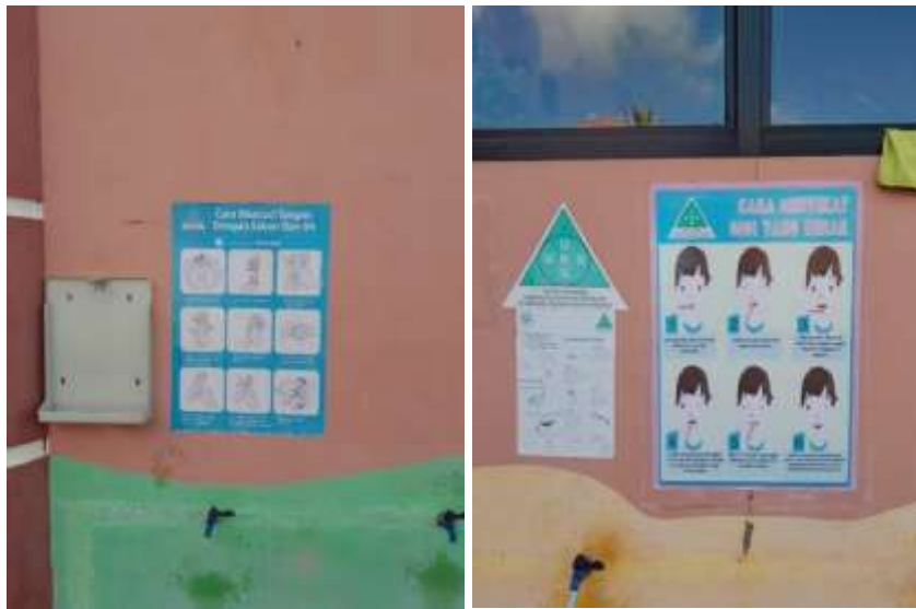
Gambar 4.30 Poster Cuci Tangan