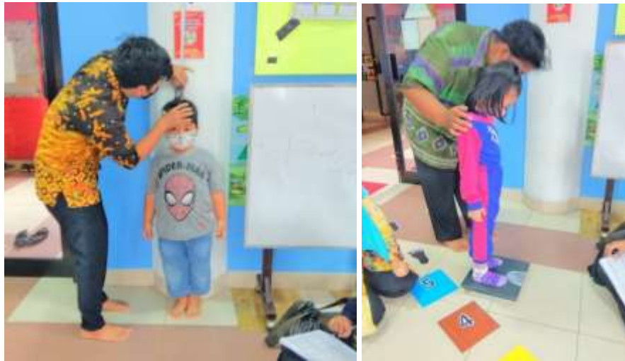
Gambar 4.17 Pemeriksaan Tinggi Badan (TB) dari Puskesmas

Puskesmas juga memberikan program pemberian Vitamin A yang dilakukan dua kali dalam satu tahun dan dilakukan pada periode bulan Februari dan Agustus. 4